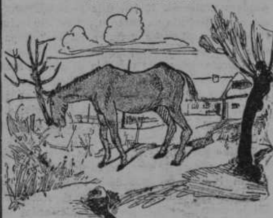
Kje je živinozdravnik?