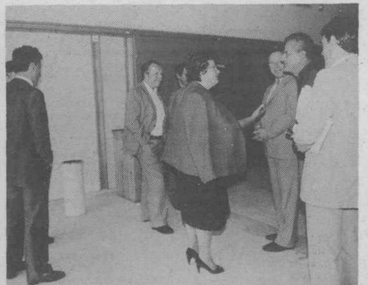
Pogovor pred posvetom