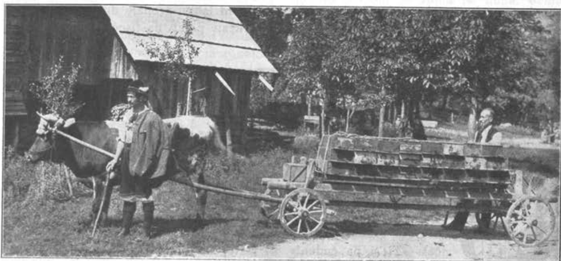
Gorenjski voz za prepeljavanje čebel.

Tudi to okrožje, posebno v Bohinjski Beli in v Gorjah, ima precej spomladanske paše na telohu, vresju in na sadnem drevju. Večja množina vresja raste okoli Ribnega in Bodešič med Savo in Bohinjko. V Gorjah imajo čebele precej bere na borovnici. Bled ima malo spomladanske paše. Najizdatnejša spomladanska bera na Bledu je na sadnem drevju in na divjem kostanju, ki ga je v večji množini zlasti ob senčnih parkih okoli jezera. — Poletno pašo pa imajo čebele v blejskem okrožju na kadulji (travniški žajbelj), ki raste