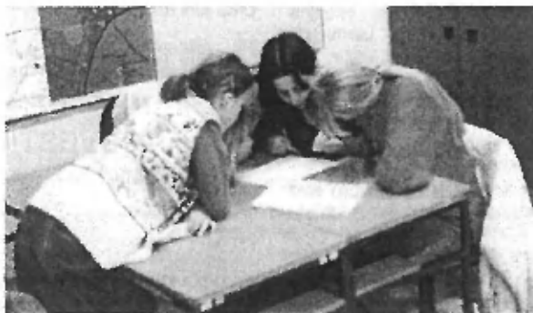
Le kateri odgovor je pravi?

Trzinski planinci pa tudi letos, podobno kot prejšnja leta, z gasilci, dimnikarji, poštarji upokojenci in mogoče še kom, po trzinskih hišah raznašajo svoje koledarje za leto 1997. Pri tem še zdaleč niso tako uspešni kot gasilci, vendar menijo, da je le prav, da sokrajanom zaželjajo srečno novo leto in jim dajo koledar s programom izletov za prihodnje leto. Med drugim bodo prihodnje leto pripravili trekning v Peru in Bolivijo, članski tabor v Dolomitih, obiskali pa bodo še celo vrsto drugih zanimivih vrhov.