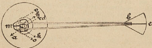
Slika br. 3.