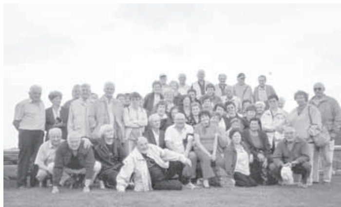
IZLET UPKOJENCEV NA POHORJE - RIBNIŠKA KOČA

V strjenem naselju Josipdola nas je ob prihodu pozdravil mogočni lipov drevored, posajen pred 1301eti. Ime Josipdol izvira iz imena prvega lastnika steklarne. V Josipdolu se je za steklarstvom (izdelovali so steklenice, kozarce, vrče, okrasne