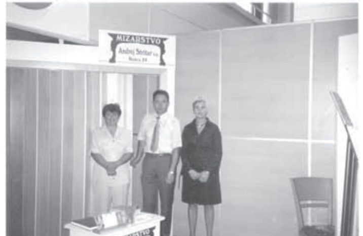
OBRTNI SEJEM V CELJU 2005. STOJNICA MIZARSTVA STRITAR