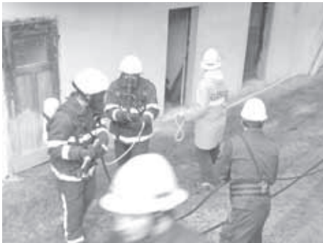
PGD DVORSKA VAS - MALA SLEVICA