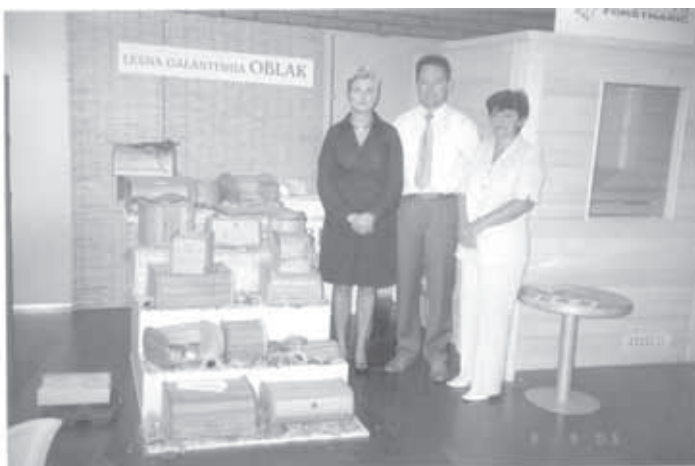
OBRTNI SEJEM V CELJU 2005. STOJNICA LESNE GALANTERIJE OBLAK