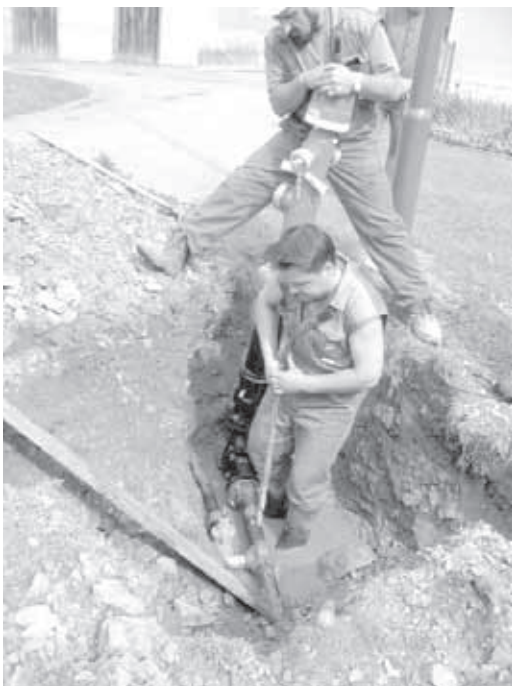
HIDRANT BO SEDAJ SLUŽIL SVOJEMU NAMENU