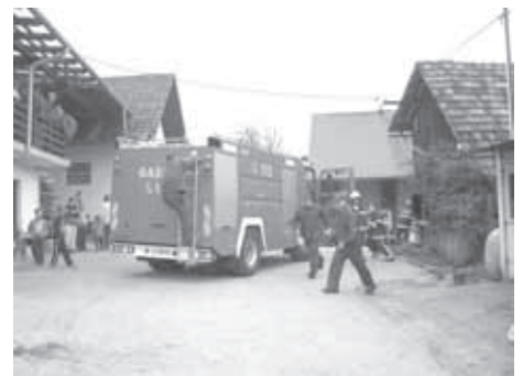
PGD VELIKE LAŠČE