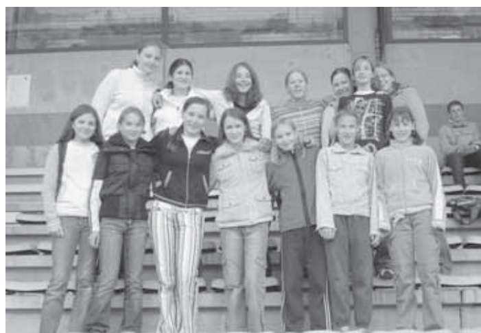
UČENCI IN UČENKE, KI SO ZASTOPALI OŠ PRIMOŽA TRUBARJA