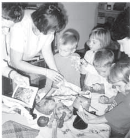
PREDMETI Z OTOKA MADAGASKAR SO VZBUDILI ZANIMANJE