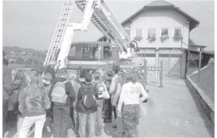
GASILSKA LESTEV JE VZBUDILA VELIKO ZANIMANJA TUDI MED ŠOLARJI.