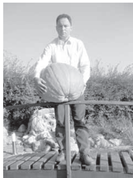
NAJVEČJO BUČO, KI PO OBSEGU MERI 158 CM IN TEHTA 33 KG, SO PODARILI VELIKOLAŠKEMU ŽUPANU.

Pogovor je tekkel pozno v noč. Vprašanj in izčrpnih odgovorov ni zmanjkalo. Poslovile smo se s polno glavo znanja o