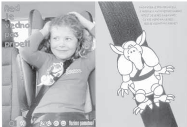
RED JE VEDNO PAS PRIPETI