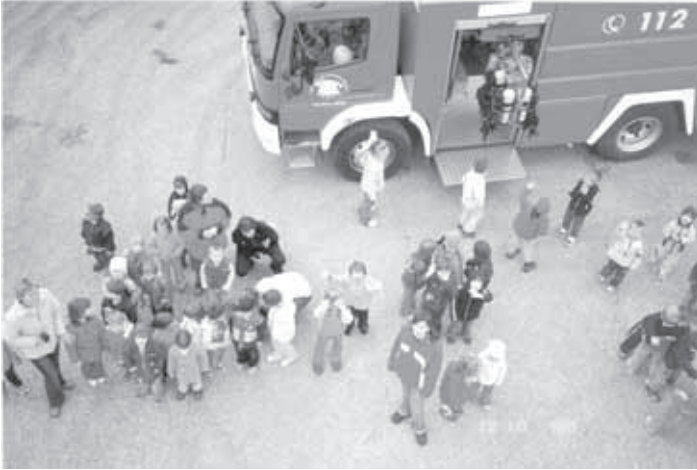
VSI BI SE HOTELI DVIGNITI Z LESTVIJO IN VIDETI SVET OD ZGORAJ.