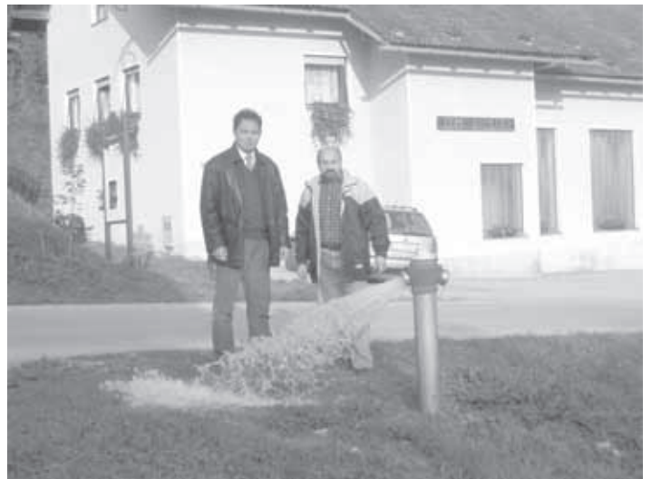
VODA IZ VRTINE PODSTRMEC JE PRITEKLA IZ NOVEGA HIDRANTA PRED GASILSKIM DOMOM NA KARLOVICI.