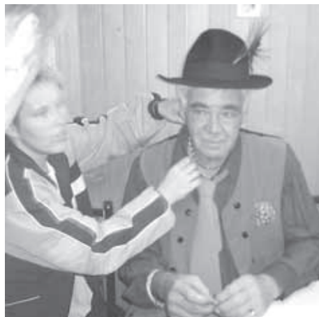
MAŠKARE Z GRADEŽA NA ZLATI POROKI