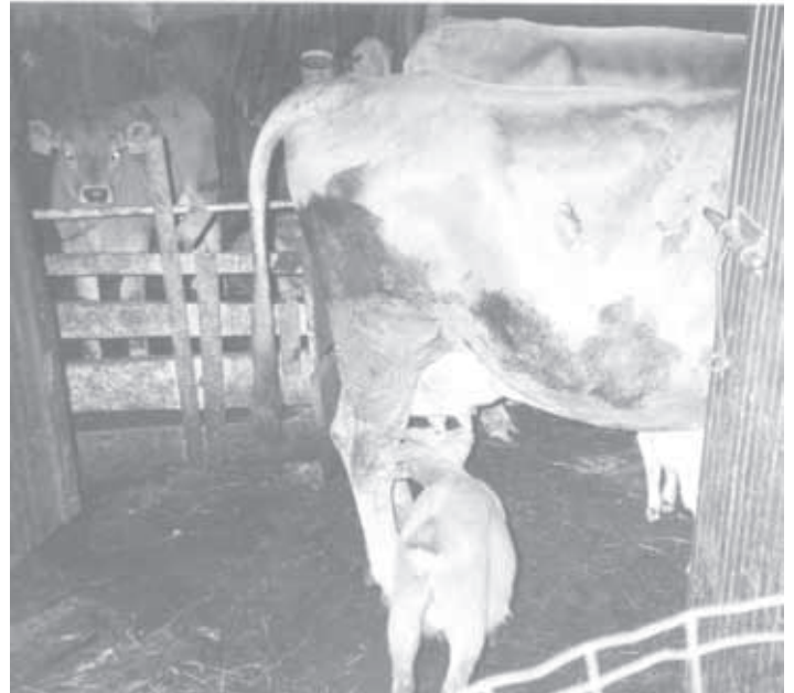
KRAVA MIRA JE POMAGALA BOLNI KOZI PRI VZREJI DVEH KOZLIČKOV