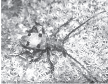
BUKOV KOZLIČEK

Vlada Republike Slovenije je 29. aprila 2004 določila območja Natura 2000 v Sloveniji z Uredbo o posebnih varstvenih območjih (območjih Natura 2000). Določenih je 286 območij, od tega jih je 260 določenih na podlagi direktive o habitatih in 26 na podlagi direktive o pticah. Območja zajemajo 36 odstotkov