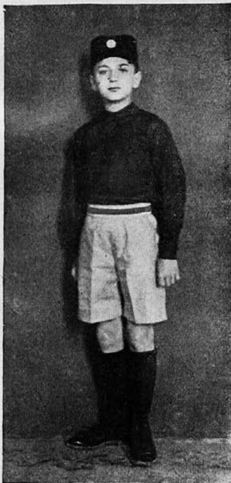
Propisno svečano odelo za muški na- raštaj. (Vidi opis u „Sokoliču“ br. 3.-4. str. 50.)