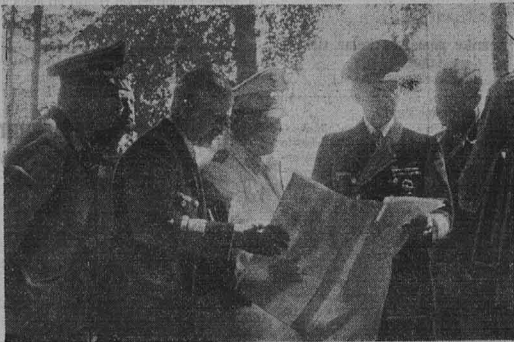
Reichsmarschall z Großadmiralom Dönitzom pri razgovoru v Führerhauptquartleru

Kmalu po začetku sovražnosti s Sovjetsko zvezo so nastopile najprej posamič, potem pa v vedno večji meri nemške pomorske bojne sile v Črnem morju, katere so bile kasneje po zavzetju najvažnejših sovjetskih črnomorskih pristanišč ojačene tudi z mornariškim topništvo. V brezštevilnih ofenzivnih sunkih, ki so se vršili pogosto noč za nočjo proti sovražnemu pomorskemu prometu, so lahke nemške pomorske bojne sile in podmornice doslej potopile 65 ladij, predvsem petrolejske ladje, prevozne ladje, lahka vozila in vozila za nove pošiljke sovražnika s skupno 92.400 brt in številne druge poškodovale. Razen tega so bile v istem času potopljene: sovjetska poveljniška ladja flotilij »Moskva«, en torpedni čoln, trije brzi čolni, en topniški čoln, ena podmornica, en spremni čoln, tri stražne ladje in dve oklopljeni stražni ladji. Zguba skoro 100