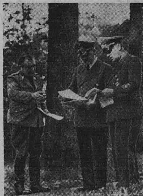
Besprechung im Führerhauptquartier

In den amerikanischen Wirtschaftskreisen wird