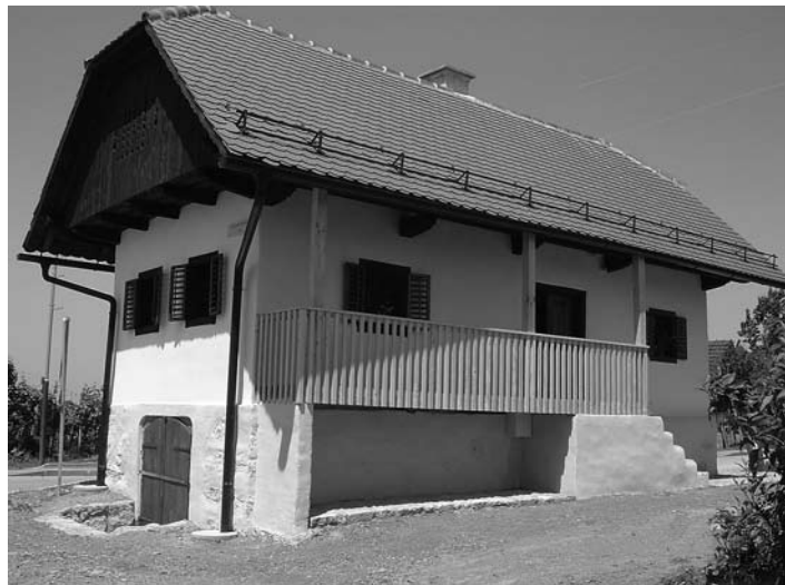
Danes ponosna priča preteklosti