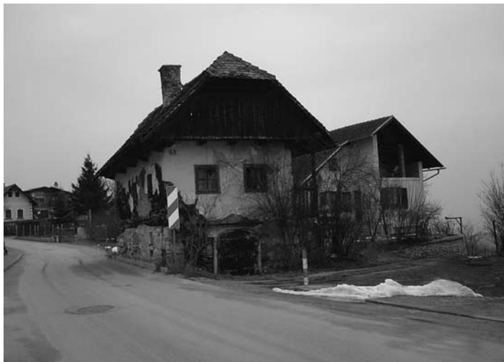
Okrušena lepota nekoč