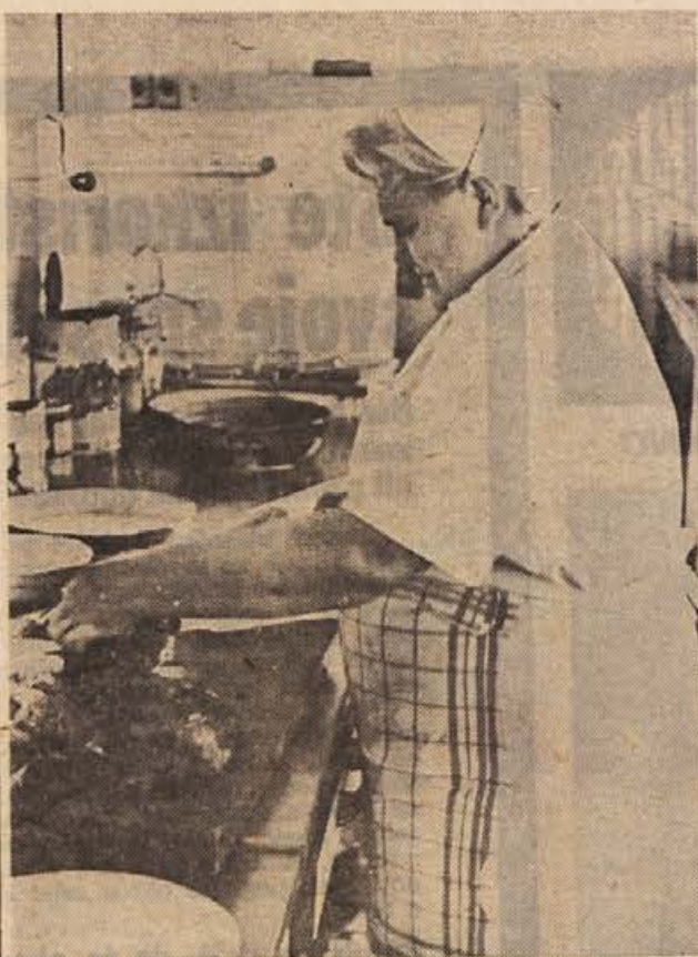
Za kuharice in natakarice ob dnevu žena ni bilo praznika. Gostišča so bila polna od petka do nedelje zvečer. Na sliki: pogled v kuhinjo Restavracije na Griču.