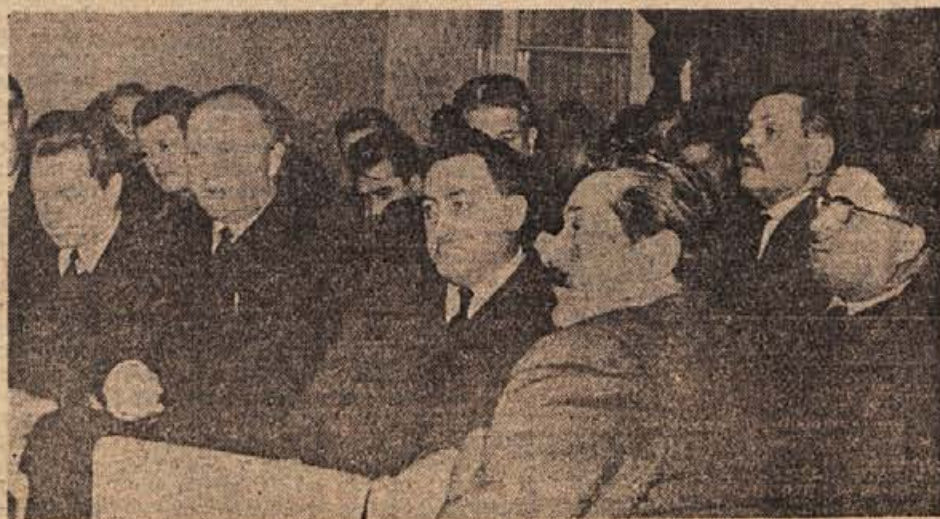
Podpiramo, vendar tudi zahtevamo svoje! Tako so menili poslanci, družbeno-politični delavci ter župani iz osmih občin, ko so se zbrali v Metliki na seji kluba poslancev