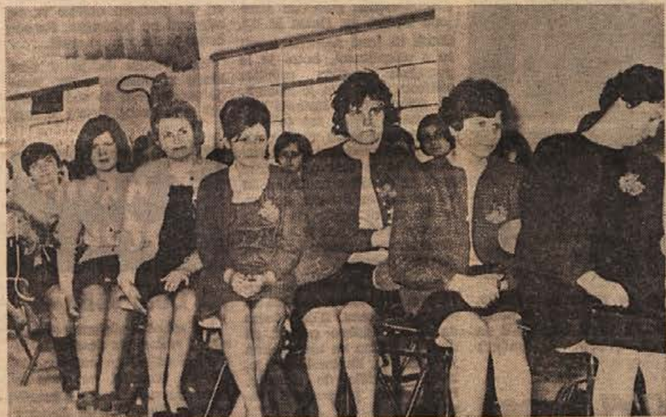
Tovarna perila LABOD v Novem mestu ima med 540 zaposlenimi v veliki večini ženske. 8. marec, ki je hkrati tudi praznik kolektiva, so proslavili v Novem mestu in v Krškem s pogostitvijo, z lepim kulturnim programom in z razgovorom o uspehih ter o svojih načrtih. Spomnili so se tudi upokojevc. Na sliki: članice kolektiva med proslavo

»Ena gospa je rekla, da bo predlagala naši občinski skupščini, naj s posebnim odlokom dosmrtno opusti plačevanja samoprispevka za novo šolo vse tiste brhne školopretke, ki imajo, ročki, samo svoje hiše in nemi-ke limuzine, za nič otrok ter se teše odpovedo desetaku ali dvema na mesec, kot na primer NOVOTEKSOVI delavci...»