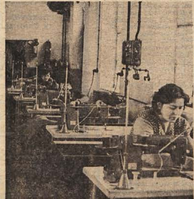
NOVA MOZNOST ZA ZAPOSILITEV. Tovarna šivalnih strojev na Mirni je letos odprla nov obrat — šivalnico opreme za stanovanjske priklovice, kjer so zaposlili čez 20 ljudi, nekdanjih režijskih delovnih moči. Nove zaposlitve predvidevata tudi obrat MODNA OBLAČILA v Trebnjem in podjetje KEMOOPREMA. Na sliki je notranjost šivalnice.

V vseh krajih občine je bilo že 7. marca zelo živahno. V Sevnici je bila akademija, ki se je udeležilo veliko število žensk, v soboto pa sta obe sevniški konfeksijski podjetji priredili zabave za svoje delavke.