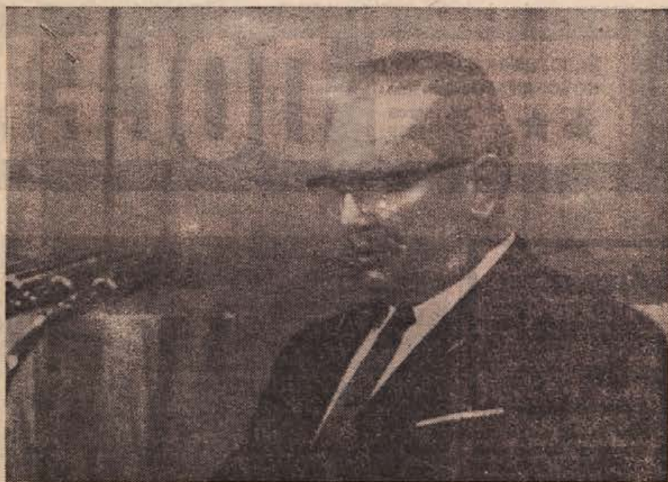
V BEOGRADU se je v Veliki dvorani Doma sindikatov v torek ob 17. uri popoldne začel deveti kongres Zveze komunistov Jugoslavije. Otvoritevna svečana seja je bila posvečena 50-letnici naše komunistične partije. Govornik na tej seji je bil tovariš Tito, ki so ga delegati pozdravili z navdušenim ploskanjem.