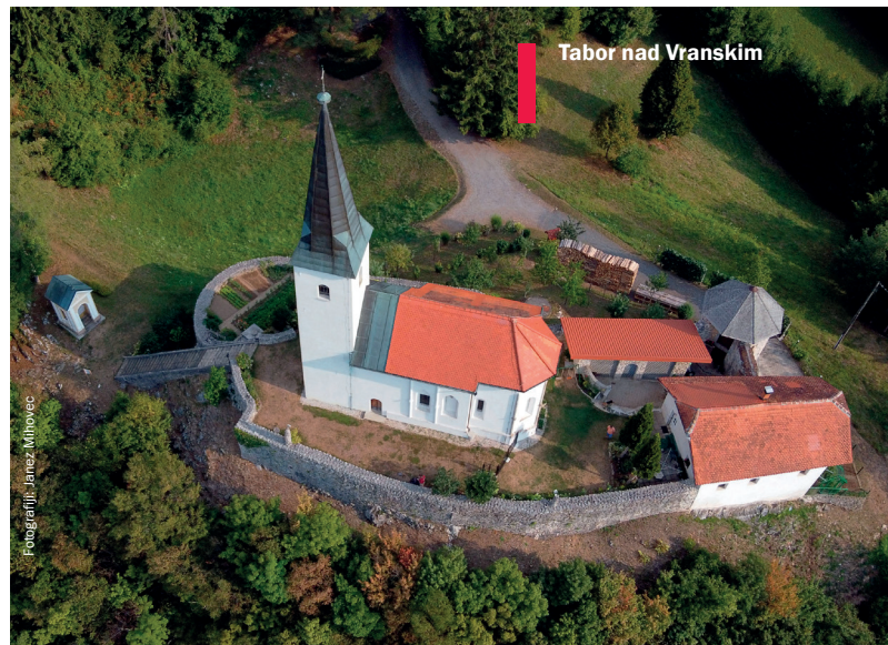
■ Tabor nad Vranskim

V Vipavski dolini so tabori doživeli poseben razcvet. Avstrije v teh krajih niso ogrožali le Turki, ampak tudi vedno sovražni Benečani. Tako so se obrambe lotili velikopotezno. Utrdili so celotna naselja. Vipavski Križ in Črnotiče sta bila protiturška tabora, ki sta še danes naseljena.