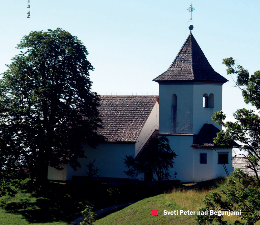
■ Sveti Peter nad Begunjami

trdnjave ni gledala s kakšnim posebnim veseljem. Zavedali so se, da so lahko tudi potencialno oporišče kmečkih uporov, vendar jim ni preostalo nič drugega, saj bi drugače izgubili dragoceno delovno silo in davkoplačevalce.