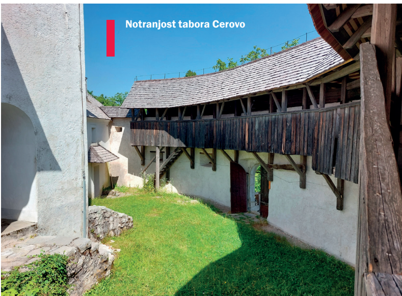
Notranjost tabora Cerovo

Z zmago nad Turki pri Sisku je bilo za Slovence konec turške nevarnosti, Evropa pa je bila dokončno odrešena po porazu Turkov ob pohodu na Dunaj leta 1683. Turška vojska se je umaknila globoko na Balkan in kar naenkrat so protiturški tabori izgubili pomen. Tisti v naseljih so večinoma postali vaški »kamnolomi«, drugi, na bolj osamljenih krajih, pa so se večinoma ohranili – nekateri bolj, drugi nekoliko manj. Protiturški tabori so neminljiv del slovenske zgodovine in arhitekture. So jasen dokaz stoletnih prizadevanj, da se ohrani slovenski narod, kultura in vera. Kadarkoli vidimo kak nenavaden zvonik ali ko vidimo krožno obzidje, lahko zaslutimo, da gledamo tabor. Najlepše se je ohranil tabor Cerovo pri Grosupljem, ki je še danes tak kot pred stoletji. ■