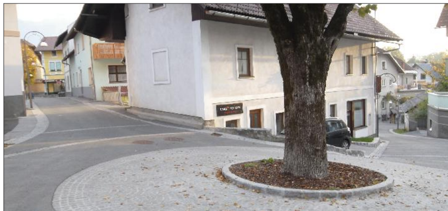
Obnovljeno jedro Bleda, vas Grad.

Evropska ocenjevalna komisija Entente Florale Europe je med drugim pohvalila razvojni pristop, saj da so vsi planski dokumenti pred sprejetjem ustrezno predstavljeni javnosti. Opazila je, da si občina zelo prizadeva ohranjati stara vaška jedra, ki so lepa, urejena in čista, prav tako je pohvalila grajski kompleks, ki da je zgledno urejen in vreden ogleda, še posebej pa so pohvalili novo pešpot skozi gozd z »zelo harmonizirano varovalno leseno ograjo«. Biser Bleda predstavlja Otok, pohvalili so nov zbirni center za odpadke skupaj s čistilno napravo, urejeno in vzdrževano mestno pokopališče, urejene zasebne vrtove, okoljsko izobraževanje mladih, pohvalili so veliko število društev, ki prav tako ogromno naredijo za splošen izgled Bleda.