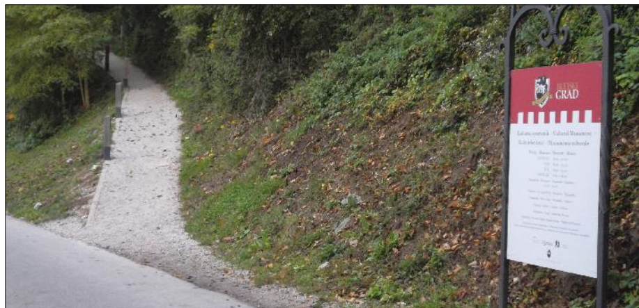
Nova pešpot na grad.

Komisija pa je Bledu dala tudi nekaj priporočil. Med njimi je poenotenje urbane opreme, te naloge pa se Občina Bled že loteva, priporočajo ozelenitev parkirišč, posebno pozornost je treba nameniti označbam pomembnih stavb, zmotili so jih odprti koši za smeti, previsoko grmičevje ob jezerski obali, ki ponekod zakriva pogled na jezero, še posebej pa so opozorili na ponekod že kar nevarno jezersko brežino. Velik problem Bleda je seveda promet, zato priporočajo, da Občina Bled ves napor usmeri v izgradnjo obeh razbremenilnih cest, tega pa se seveda zelo dobro zavedajo tudi na Občini.