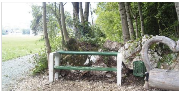
Podroje - klop in korito.