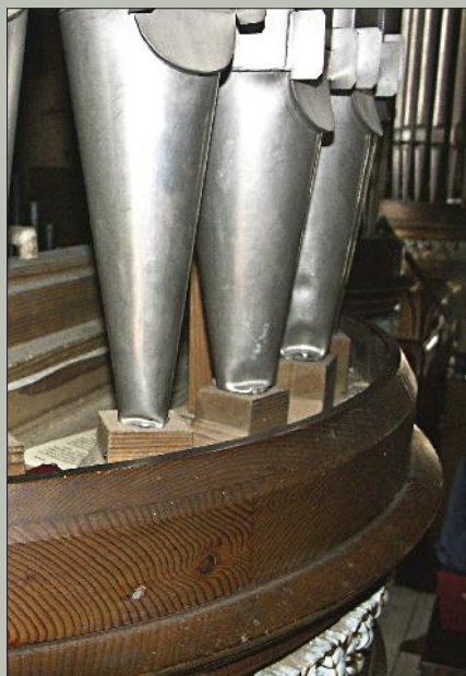
Piščali v pročelju orgel se kritično posejajo.

Sto let je za vsak tehnični izdelek dolga doba, še posebej, če je stalno v uporabi, pnevmatske orgle, kakršne so obojne na Bledu, pa redko zdržijo nekaj desetletij. Orgle so seveda pihalo, torej za ustvarjanje zvoka potrebujejo zrak, ki se tlači iz meha po kanalih v piščalke, te orgle pa imajo tudi pnevmatski mehanizem. Kaj to pomeni? Preprosto povedano, povezava med tipkami in ventilčki, ki odpirajo dovod zraka v piščalke, je izvedena z množico drobnih cevok. Stisnjen zrak, ki ga v tako cevko spustimo ob pritisku na tipko, potuje do enega ali več mešičkov. Podobno, kot olje pri bagru, le da je tu vse skupaj zgodri precej bolj hitro. Ko se mešiček hipno napolni, odpre ven-