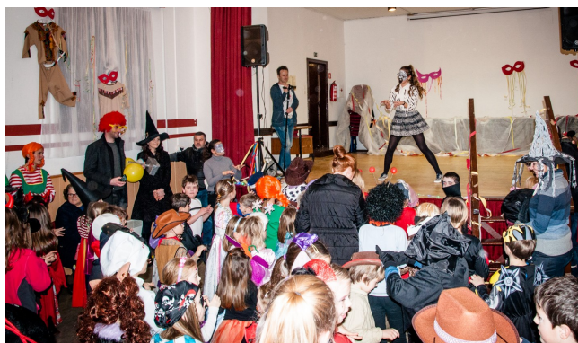
Rajanje z zebro v dvorani na Lavrici.