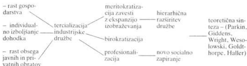
Skica 1: Model nove vertikalizacije družbe

Gospodarski napredek in zviševanja dohodkov so sicer vsekakor zboljšali življenjske razmere ljudi v kapitalističnih družbah, komaj pa so spremenili razmerja družbene neenakosti (prim. Beck 1983:36–37; Hradil 1987). Ne bi bilo treba najprej dokazati o »delavcu blaginje« (Goldthorpe et. al. 1969) v šestdesetih, ali o »novem delavcu« (Hörning 1971) in o »novem razredu« (Gouldner 1980) v sedemdesetih letih, da bi spoznali učinke pomnoženih možnosti mobilnosti, potrošnih dobrin in prostočasnih možnosti pri množici delojemalcev na eni strani in učinke novih oblik vpliva, privilegijev in življenjskega stila pri razširjajočih se srednjih plasteh na drugi strani. Nesporno je, da so se povečale individualne razvojne možnosti predvsem v privatni sferi. Sporno pa je, ali sta in koliko sta zaradi tega nastopili »diverzifikacija in individualizacija življenjskih položajev in življenjskih poti«, ali da bi skopnele celo »subkulture razredne identitete« . . . , kot meni Beck (1983:36). Institucionalizacija merila uspešnosti v kapitalistično določeni industrijski družbi je gotovo zrahljala prepletenost posameznih statusnih