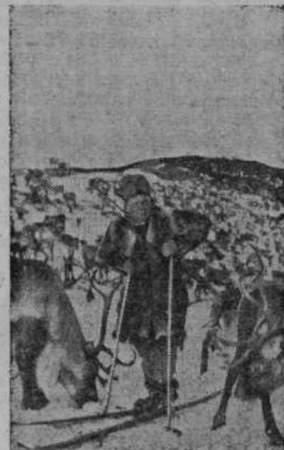
Finci so se umaknili v notranjost dežele z 200.000 severnimi jeleni