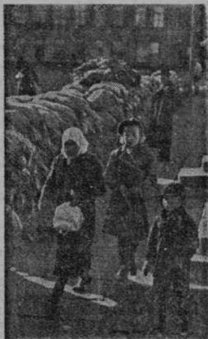
Finsko mesto Wiborg ob južni obali so zavarovali Finci proti ruskeemu topniškemu ognju z vrečami, v katerih je pesek