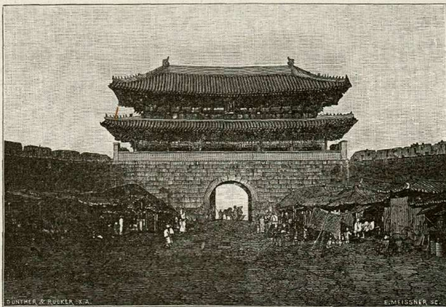
Južna vrata v korejskem glavnem mestu Seulu.