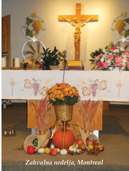
Zahvalna nedelja, Montreal

Martinovanje • Tradicionalno jesensko prireditev 'martinovanje s kolinami' smo imeli zvečer v soboto, 7. novembra. Člani/ce cerkvenega odbora in nekateri župljani so spet z