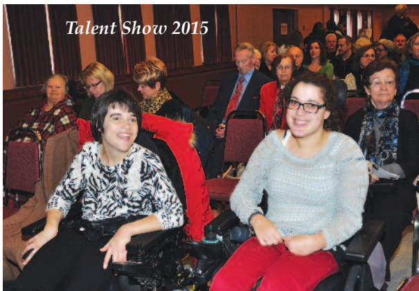
Talent Show 2015

Zaključni dan volitev za ali proti združenju bank je bilo v sob., 28. nov. in ned., 29. nov. Mnogo je že prej potekalo srečanj in razgovorov, da bi pretehtali in odgovorno sklenili ter izvedli predlagane načrte. Združitve se je zgodila in upamo na več pozitivnih posledic nadaljnega delovanja.