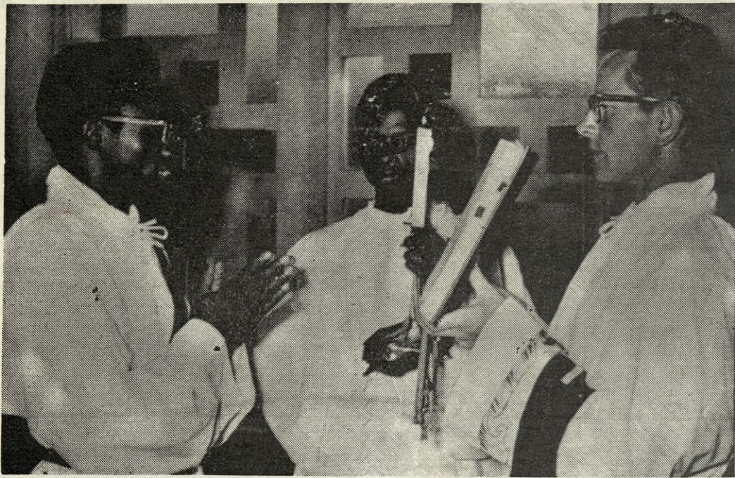
Domaći duhovniki — upanje Afriške Cerkve

Prvič v življenju sem obiskal slovenske župnije na Koroškem. Ni bilo veliko časa — le nekaj dni. Toda pod vodstvom tako odličnega organizatorja kot je g. Kopeinik sem se hitro srečal s številnimi duhovniki in verniki. Bil sem veselo presenečen. Predvsem zaradi živnega zanimanja naših koroških duhovnikov za misijonsko delo. Res dajejo lep zgled vsem našim duhovnikom v domovini in zamejstvu. Dušnopastirski urad v Celovcu mi ostaja v nepozabnem spominu.