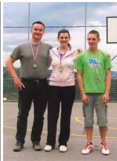
Najboljši v skupini od 16 do 25 let