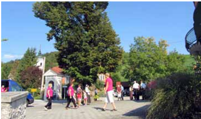
Pevci se vračajo s pozdravnega petja pod lipo v Krašnji.

preteklost kraja, da se prepozna domače narečje, ki sicer ni tako izrazito kot nekje drugje, se pa razlikuje od pogovornega jezika.