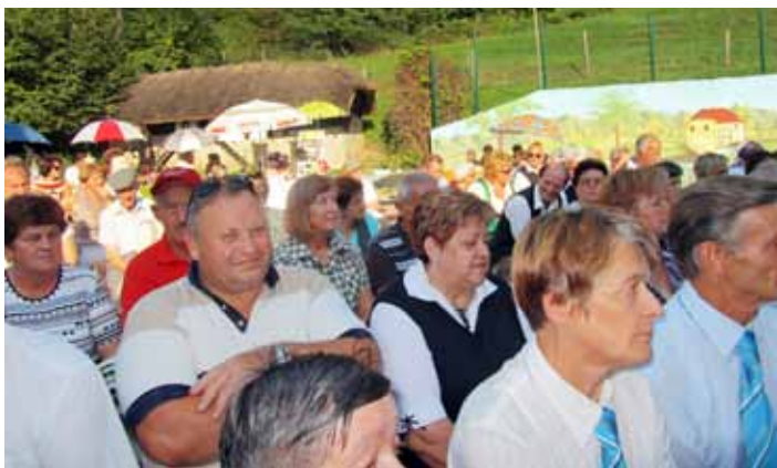
Vsako leto večje število obiskovalcev prireditve, v ozadju pridni rokodelci