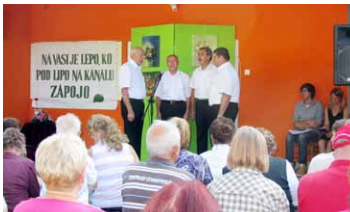
Kvartet Zvon s Turjaka je letos prvič nastopil na srečanju pevcev v Krašnji.