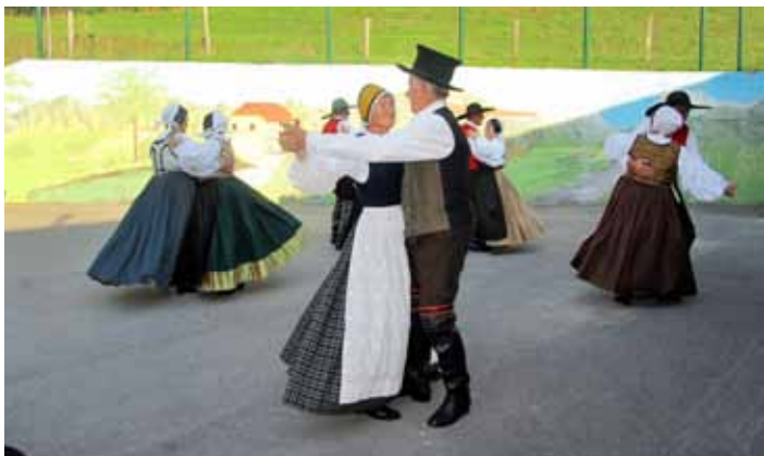
Plesalci kulturnega društva FOLKLORA

Za to so trije vzroki, ki pa se med seboj dopolnjujejo. Prvi je ta, da je v začetku leta 2004 začela delovati naša skupina pevcev ljudskih pesmi, drugi pa želja po srečevanju ljudi iz različnih slovenskih pokrajin. Tretji vzrok je, da v našem društvu ohranjamo našo naravno in kulturno dediščino, da smo začeli zbirati stare predmete, da skrbimo za poznavanje naših pisateljev, da pripravljamo gledališke prizore. V njih se prepozna