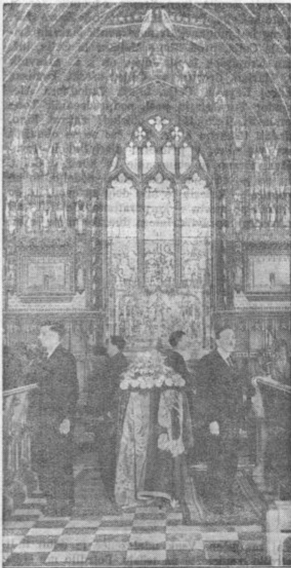
Angleški kralj Jurij V. na mrtvaškem odru v kapeli sv. Marije Magdalene v sandringhamski palači. Ob kraljevi krsti stoji častna straža, sestojeca iz članov kraljeve dvorne uprave.

vilo zastopnikov raznih držav, iz Anglije pa so svojemu kralju izkazale zadnjo čast poleg zastopnikov oblasti nepregledne množice ljudstva. Kot zanimivost naj pri tem omenimo samo okolnost, da se poleg mnogih drugih osebno udeleži pogreba tudi laški prestolonaslednik, ki bo skušal potovanje uporabiti tudi v državno politične namene. Javna tajnost je namreč, da pomenijo laški uspehi v Abesiniji za Italijo udarec, ki bi ga rada čim prej prebolela in se ga otresla.