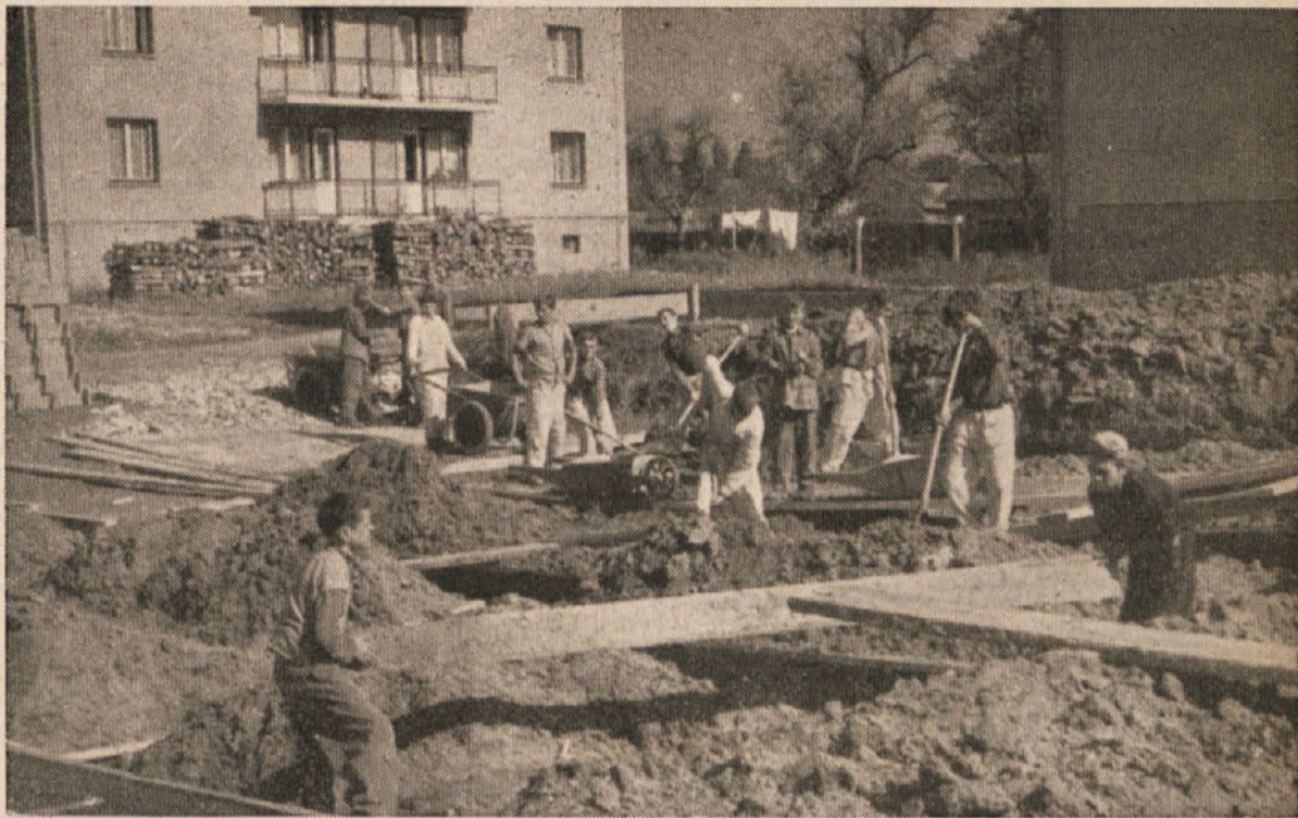
Vsak začetek je težak. Tako tudi izkop gradbene jame, ki pa bo tečajnikom — bodočim zidarjem — prav tako koristil

Vsem odlikovanim in predlaganim za odlikovanje iskreno čestitamo. Franc Vitanc