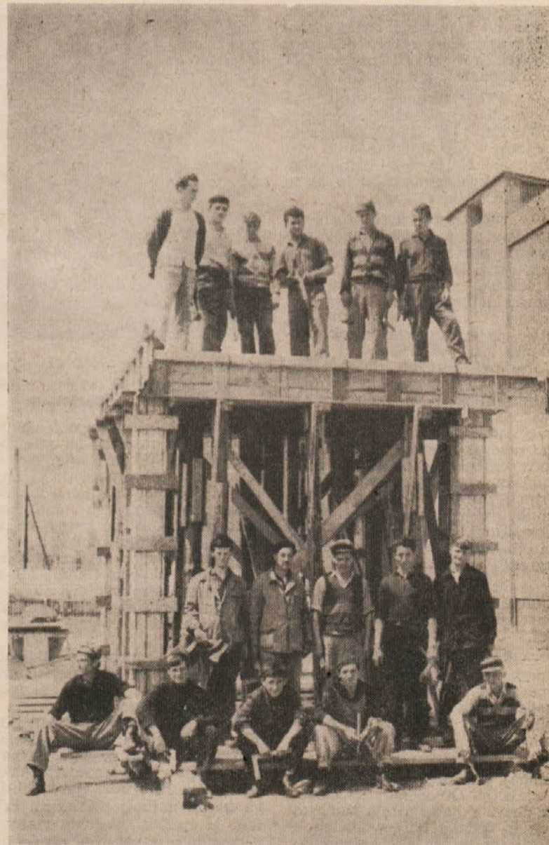
Na sliki je skupina tečajnikov — opažarjev — ki so v organizaciji izobraževalnega centra pridobile osnove preizkusili v praksi

ZK se bo dosledno borila proti vsaki samovolji in kršenju načelnih sklepov, sprejetih na letni konferenci komunistov Ingrad.