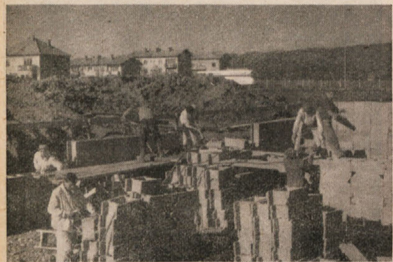
Se nekaj trdne volje in vztrajnosti, pa bodo lahko tudi mladi zidarji enakovredno stali ob svojih starejših izkušenih tovariših

Kolektivu GIP Ingrad želijo vsi vajenci in instruktorji v letu 1964 mnogo delovnih uspehov v prepričanju, da z večjo produktivnostjo kujemo sebi in drugim boljše življenje.