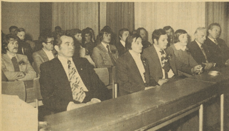
V ZK so bili sprejeti predvsem mlajši delavci

katerega lahko upravičeno trdimo, da je bilo zelo uspešno, saj so družbenopolitične organizacije v TOZD in podjetju prispevale svoj delež k reševanju vseh važnejših vprašanj, k izboljšanju medsebojnih odnosov, ne nazadnje pa mislim, da lahko pripišemo družbenopolitičnim organizacijam tudi velik delež pri realizaciji sprejetih planov in gospodarskih uspehov v letu 1975. Še posebno se je vloga ZKS in ostalih družbenopolitičnih organizacij pokazala ob sprejemanju stabilizacijskih programov TOZD in podjetja. Kakšne pa bodo naše naloge v letu 1976? Vsekakor bo prva, da bomo v vseh OOKZK in svetu ZK IMP izdelali akcijske programe in analize dosedanjega dela na podlagi sklepov 5. seje CK ZKS, da se bomo še nadalje zavzemali za realizacijo stabilizacijskih programov, več pozornosti bo treba posvetiti družbeni samozaščiti, enako pa tudi še nadaljnjemu razvoju samoupravljanja v TOZD in podjetju in krepitvi dobrih medsebojnih odnosov. C. K.