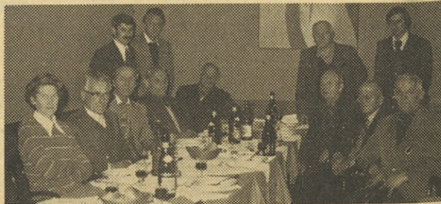
Upokojeenci TOZD TIO Idrija zbrani na srečanju

zasebnem obrtniku. Komunalno podjetje se je nato preimenovalo v Obrtne delavnice SIMPLEX, nato v Obrtno podjetje Simplex in končno v TIO, ki se je kot TOZD pripojila k IMP. Tov. Kavčič je skozi vsa ta leta vztrajal. Bil je 2 leti strugar, delal nato ključavničarska dela, končal leta 1959/60 večerno delovodsko šolo in postal mojster v delavnici, kjer je tudi še danes.