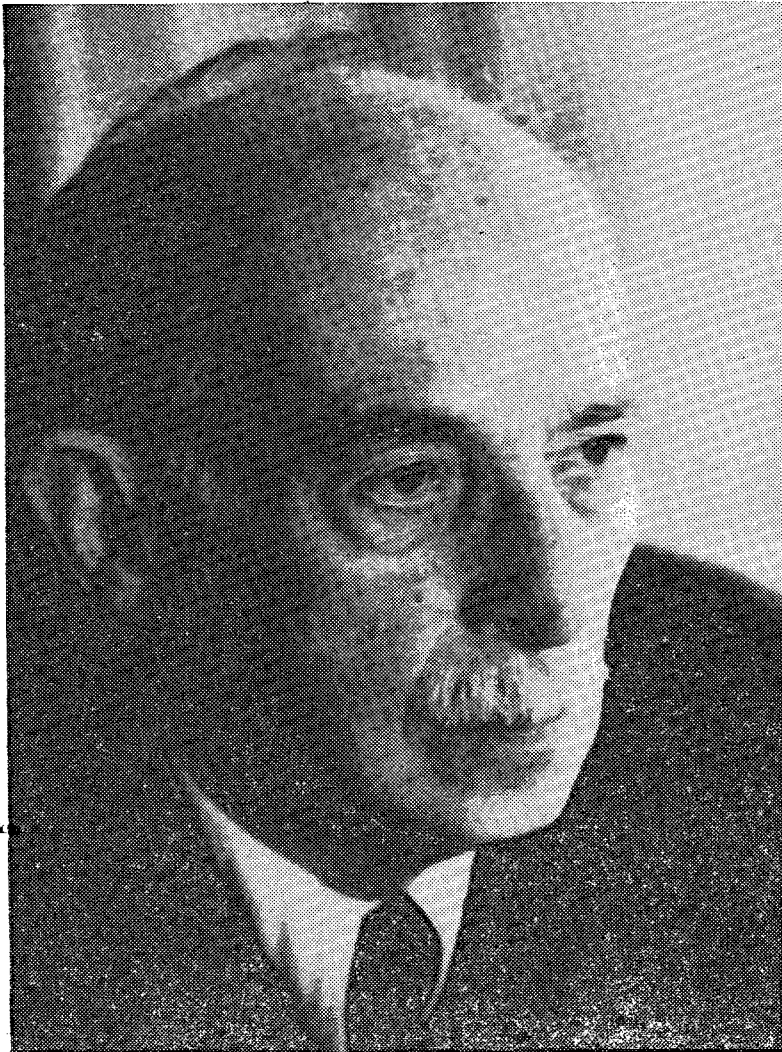
MILKO KOS (1892—1972)