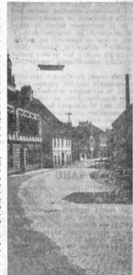
Motiv iz Konjic

Občinski sindikalni svet v Slovenskih Konjicah je sklical posvetovanje vodilnih odbornikov sindikalnih organizacij, članov obč. kom. ZKS in izvršnega odbora občinskega odbora SZDL. Na sestanku so obravnavali teze za novi pokojninski sistem. V razpravi o tezah so navzoči predlagali, naj bi pokojninska doba še nadalje ostala le 35 let za