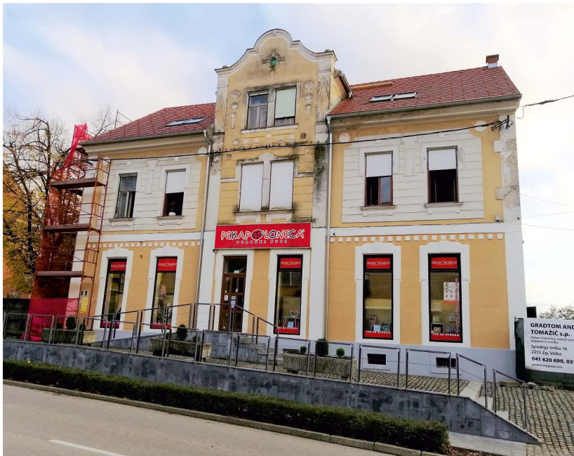
V zgradbi so med leti 1908 in 1921 delovali ormoška posojilnica, otroški vrtec in čitalnica. 72

V vseh 33-ih občinah ormoškega zastopa so bila ustanovljena » sirotinska društva , ki pazijo na izrejo in odgojo takih otrok, ki nimajo očeta. ... Največ pozornosti se mora obračati seveda na zanemarjeno pokvarjeno deco, da se reši dušnega in telesnega pogina.« Ormoški okrajni sodnik jih je ustanovil