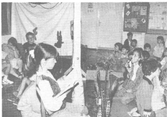
Gledalci in izvajalci predstave s senčnimi lutkami