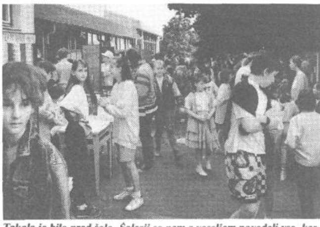
Takole je bilo pred šolo. Šolarji so nam z veseljem povedali vse, kar nas je zanimalo