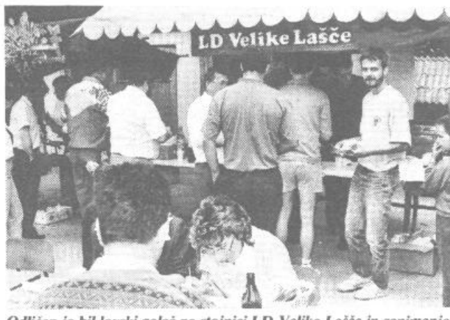
Odličen je bil lovski golaž na stojnici LD Velike Lašče in zanimanje zanj ni pojenjalo.