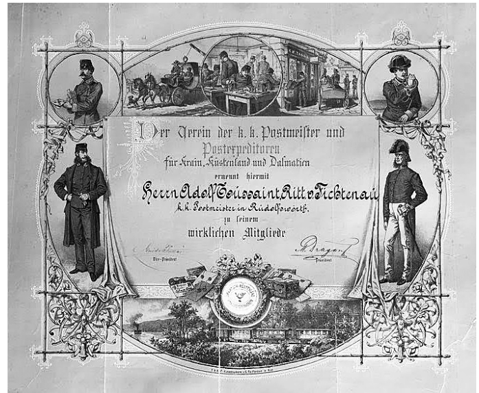
Častna diploma poštnega mojstra v Novem mestu: Adolf Toussaint pl. Fichtenau, konec 19. stoletja