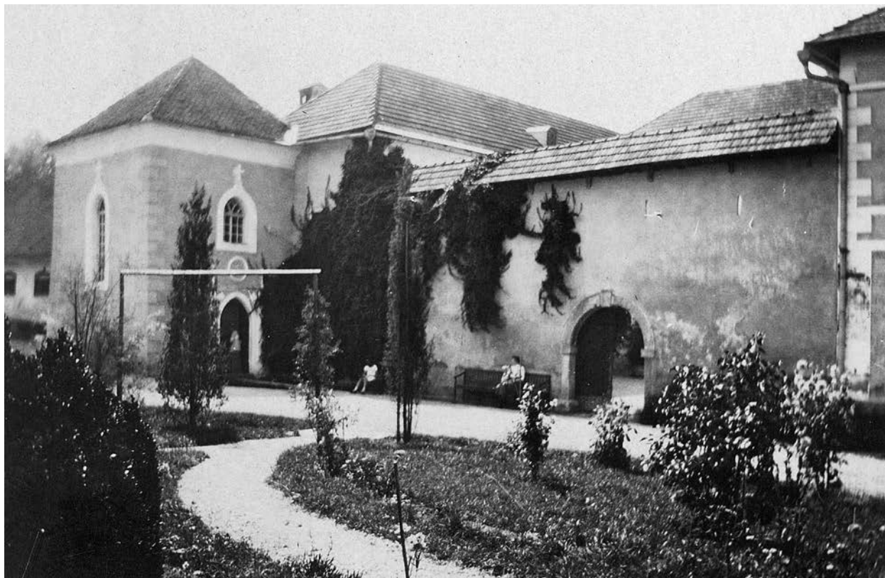
Podoba gradu Struga okoli leta 1913