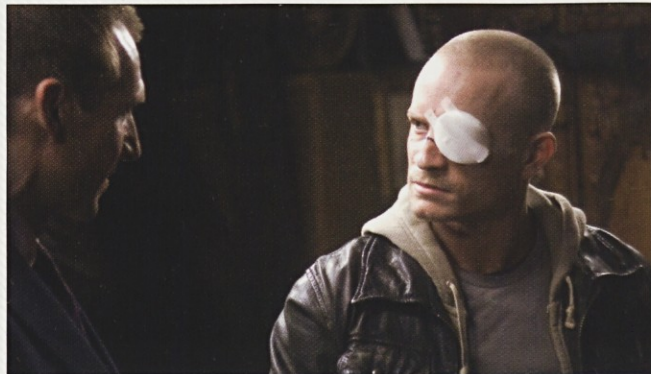
Morilca na kolektivca

Ekonomijo komercialnih gledališč zenejo zvezde, tako kot filme. Stroški so visoki in producenti hočejo neko vrsto