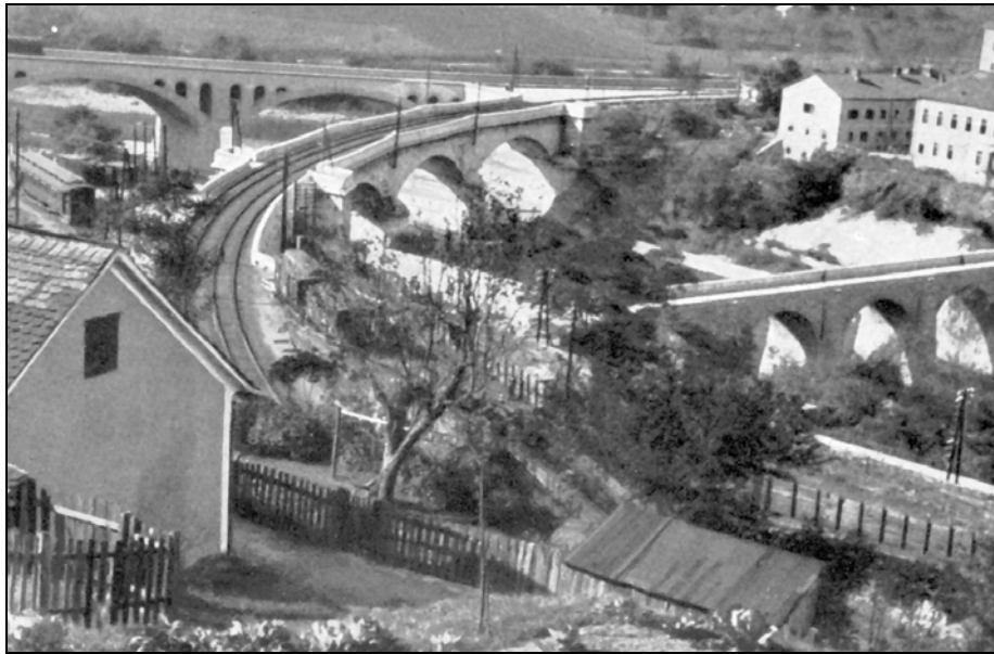
Sl. 1: Trije mostovi čez Savinjo v Zidanem Mostu. Fig. 1: The three bridges over Savinja in Zidani Most.

Podoben vtis dajejo podatki za področje pod italijansko okupacijo. Do junija 1942, po prvih uspehih partizanov, je italijanska vojska strogo nadzorovala nekaj mest in 17 železniških postaj oziroma najpombnejše proge, medtem ko so partizani že nadzorovali približno polovico tako imenovane ljubljanske pokrajine (Ferenc, 1994, 103–107).