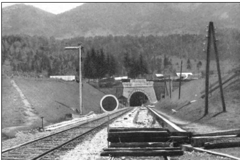
Sl. 5: Bohinjski predor (na meji med nemškim Rajhom in Italijo) na Turski progi Salzburg–Bled–Trst; Julijske Alpe (vir: Lange, 1943).