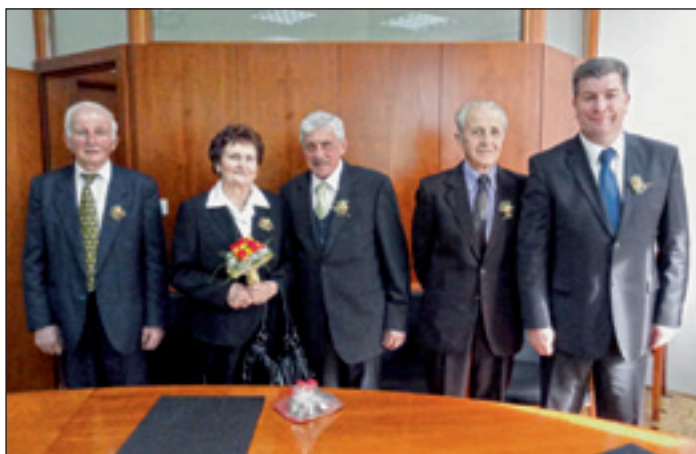
Zlata poroka Lašič