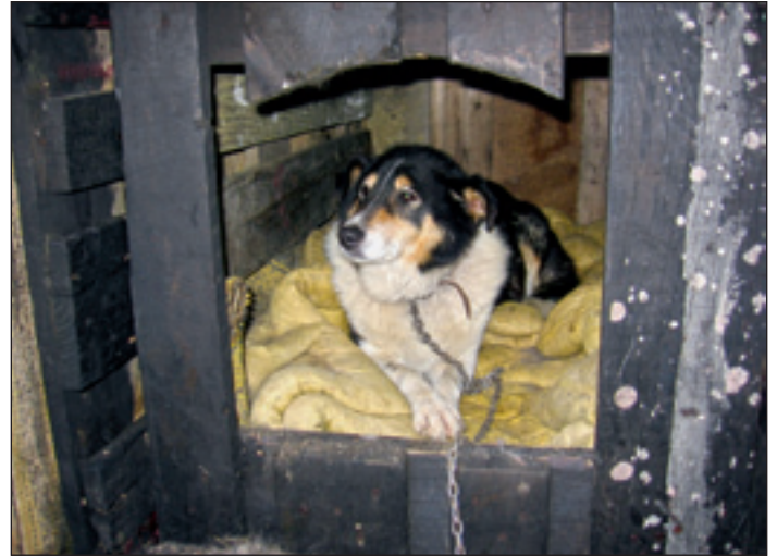
POTEM: Pes je dobil utico, daljšo verigo in hrano.