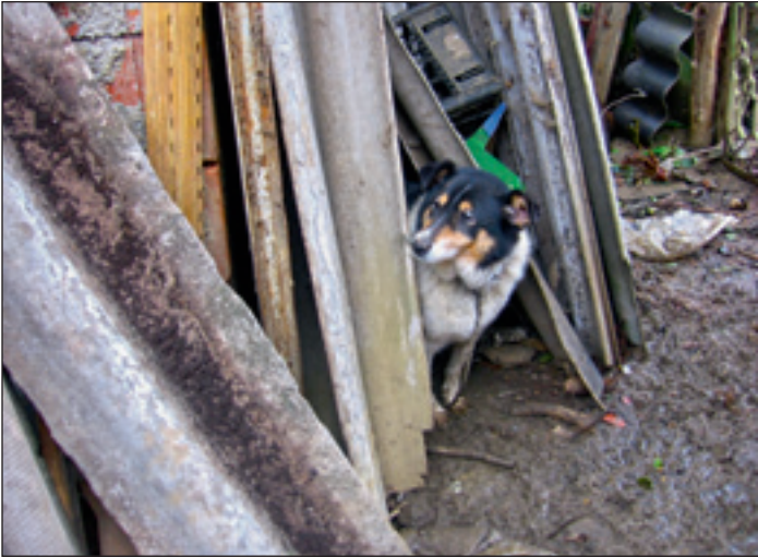
PREJ: Eden od treh psov na dvorišču v nevdržnih razmerah – brez hrane in vode, na prekratki verigi brez zavetja.

mučenj dogaja tudi za zaprtimi vrati hlevov, kjer ljudje redijo živali za prehrano, pri tem pa pozabljajo, da zrezek in klobasa najprej diha in čutita tudi bolečino ... Vse to se je dolgo dogajalo na videz neopazno, a še vedno ne vemo, je zgolj slučaj ali višja sila, da so se ljudje, ki jih takšna ravnanja motijo in bolijo, našli skupaj in se odločili, da tega več ne bodo pustili - odločili se so, da postanejo glas najšibkejših, tistih, ki ga nimajo. Živalovarstvena zakonodaja namreč obstaja in je na spletu dostopna prav vsakomur, toda nepoučenost in zatiskanje oči sta kriva, da se krivice šibkejšim še vedno dogajajo.