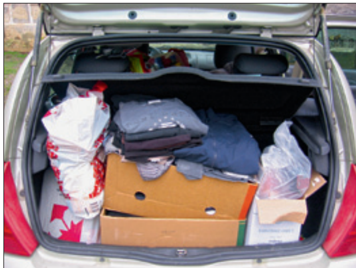
Člani zbirajo hrano in obleko tudi za pomoči potrebne lastnike živali.

prihodnje pa se bodo povezali še z osnovnimi šolami in vrtci, saj se v društvu zavedajo, da je njihova najpomembnejša ciljna publika za prihodnost prav mladina. Skrb za sočloveka in pomoči potrebne je pomembna vrlina vsakega človeka in če bomo kljub težkim gospodarskim razmeram, ki se nam obetajo, znali gojiti sočutje do šibkejšega, potem ne bomo razlikovali stiske človeka od živali, ampak bomo brez besed pomagali po svojih najboljših močeh. Prav zato Društvo za zaščito živali Ormož poudarja, da zaradi pomoči živalim niso slepi za tegobe ljudi. Kdor ima srce za živali, mu nikoli