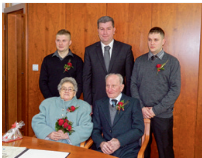
Zlata poroka Veldin