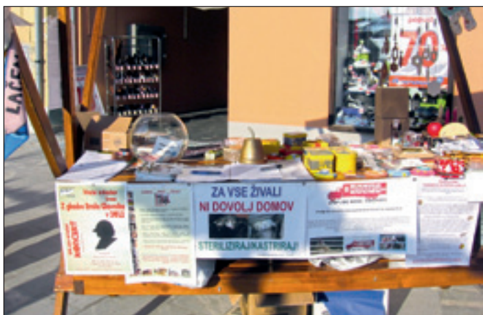
Stojnica Društva za zaščito živali Ormož