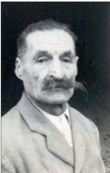
Tetec z »mustači«

Tetec je bil mizar in cementar, dosti je tesaril in pomagal pri težakih delih.