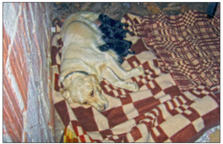
POTEM: Psico je lastnik premestil v tople in varen prostor, kjer je skotila.