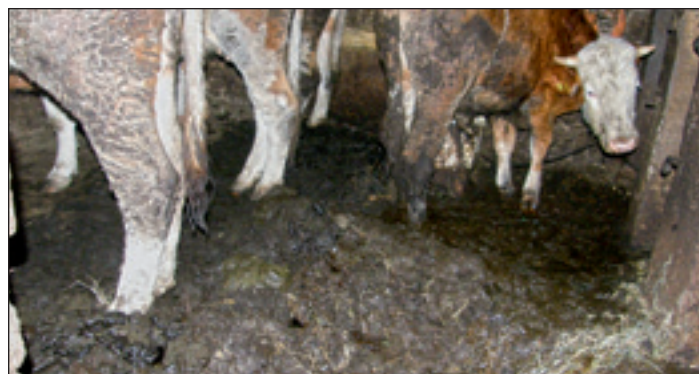
Krave v grozljivih pogojih