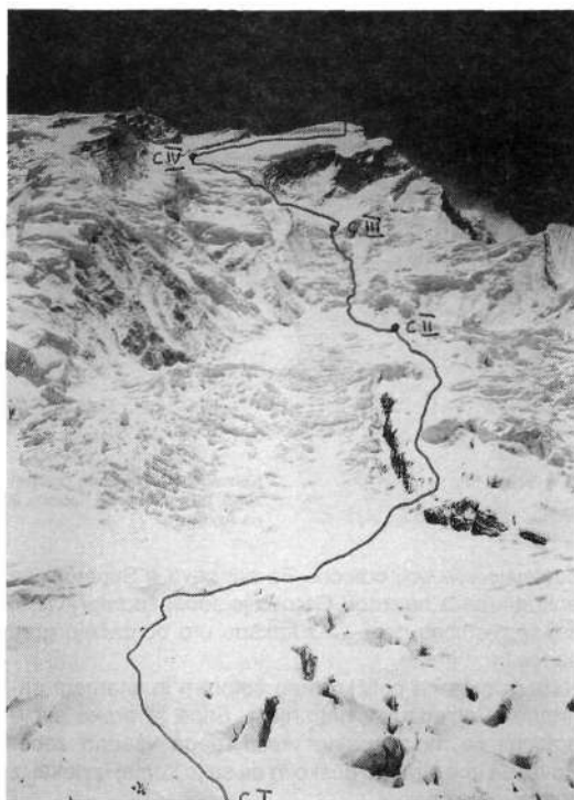
Anapurna I z vrisano smerjo vzpona in smučarskega spusta