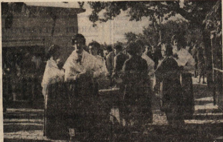
Dekleta v narodnih nošah so gostom pripenjale značke