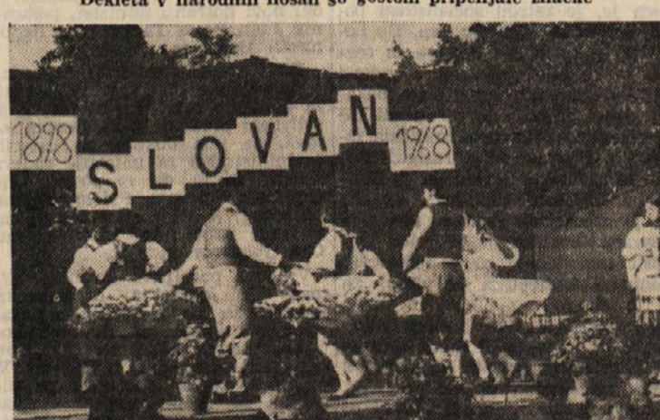
Folklorna skupina «Breg» iz Boršta pleše ples «Polka je ukazana»