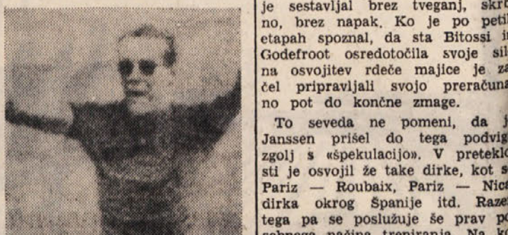
Zmagovalec «Toura» Jan Janssen

Zastor je padel nad letošnjim ni uri vožnje povsem omagal in je s tem omogočil Nizozemčevu zmago. Zanimivo je, da je bil Janssen med najmanj opaznimi osebnostmi tega «Toura». Res je zmagal na eni etapi (ob mnogih polmikah), in je bil trikrat drugi, res je pa tudi, da je ves čas skrbno stedi svoje sile in ni skoraj nikoli podvel nobene pobude. Sviji uspeh je sestavljal brez tveganj, skrbno, brez napak. Ko je po petih etapah spoznal, da sta Bitossi in Godefroot osredotočila svoje sile na osvojitve rdeče majice je začel pripravljati svojo preračunano pot do končne zmage.