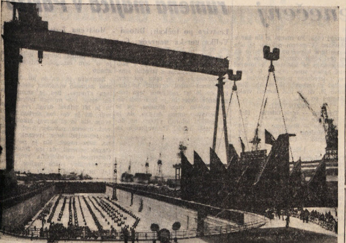
Na dno novega ogromnega suhega doka v tržiški ladjedelnici polagajo 180 ton težak vnaprej izdelan blok za novo ladjo-velikanko

Imela bo nosilnost 229 tisoč ton - Naročilo se za pet podobnih ladij - Odkrile spominske plošče petim delavcem, ki so se ponesrečili med gradnjo novih naprav