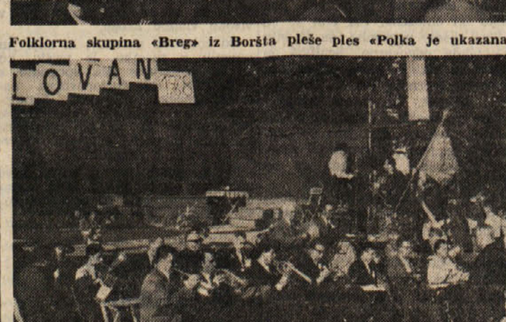
Godba na pihala «Parma» iz Trebč