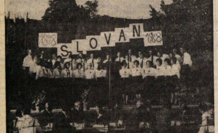
Slavlence — mešani zbor p. d. «Slovan» iz Padrič