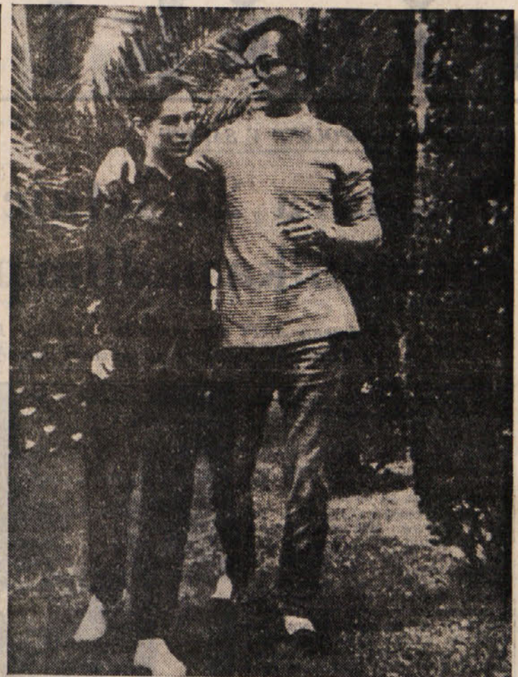
Biti hoče umetnica, ne zvezdnica, pravi Geraldine Chaplin, poljsnjajo, da jo je že opežarjal na nevarnosti zvezdniskega sistema. V resnici tudi je dobra igralka, pa še pametno dekle, ki se mu nikakor ne vrta v glavi. Na sliki jo vidimo skupaj z mladim španskim režiserjem Carlosom Sauro