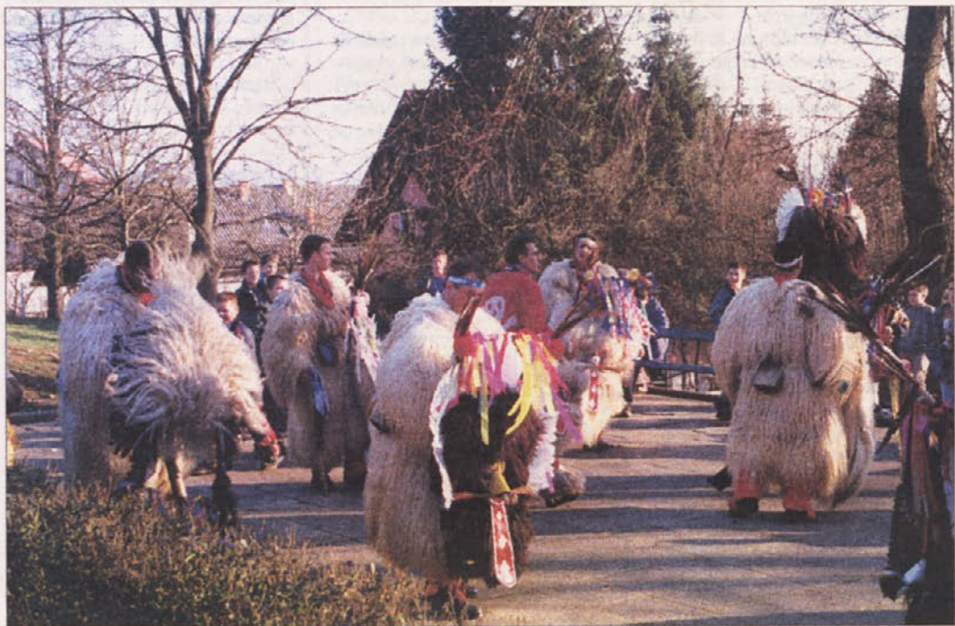
KURENTI IMAJO LETOS LAHKO DELO - Kurenti naj bi s svojim plesom in predvsem poznavanjem z velikimi zvonci odganjali zimo. Kako uspešni so bili v preteklih letih, bo vsak presodil sam, res pa je, da se je zima - po njihovi zasluzi ali pa tudi ne - vedno umaknila pomlad. Letošnje leto kurenti pri odganjanju zime nimajo ravno težkega dela, kajti snega v Sloveniji skoraj nismo videli in kar drži, da se je pravzaprav lanska jesen potegnila v letošnjo pomlad. Zato ne čudi, da so se tudi kurenti s Pruja, ki so pretekli petek prišli iz Metlike podit zimo, zaradi pomladnega vremena kaj hitro znebili težkih in vročih mask in Metličanom raje zarajali kar razoglavi. Zimo bodo pač preganjali, ko bo spet prišla v našo deželo.

Št. 8 (2687), leto LII • Novo mesto, četrtek, 22. februarja 2001 • Cena: 240 tolarjev