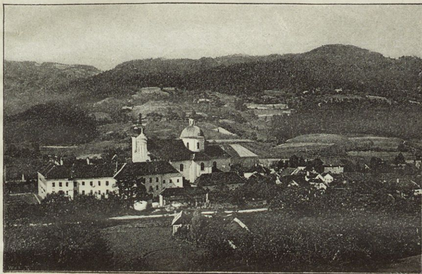
Cerkev in grajščina v Gornjemgradu.