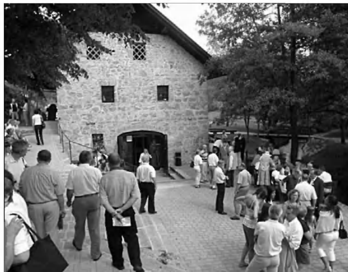
Ogled Trubarjeve domačije.