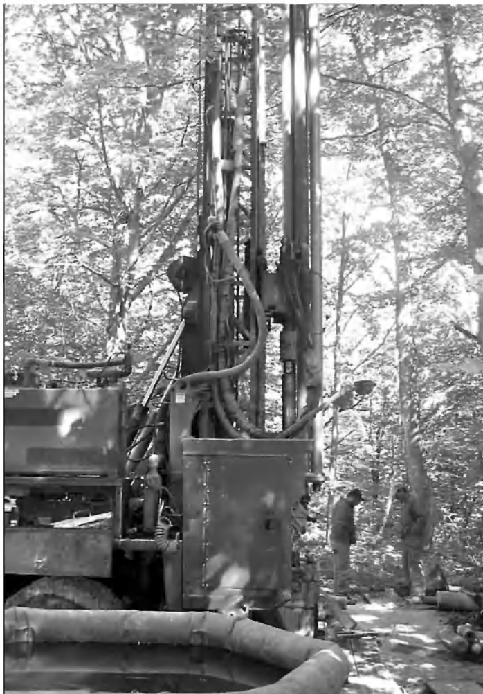
Gradnja vrtine ST-1/07.

Občina Velike Lašče obvešča občane, da je vrtina ST-1/07, ki se je začela graditi v letu 2007 v vasi Strletje, dokončana. Voda se črpa iz globine 117 m. Izdatnost vrtine je 5 l/s.