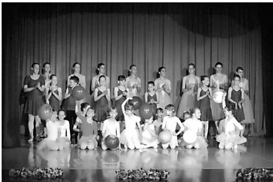
Ob koncu baletne predstave smo ujeli v objektiv vse nastopajoče.

Na zaključnem nastopu, ki je potekal na odru Levstikovega doma, posebej opremljenem z baletnim podijem, so se poleg domačih baletk (ducat najmlajših in tudi toliko plesalk v starejši skupini) predstavile še tri skupine iz Ljubljane, kjer ima Baletna šola Saša svoj sedež. Skozi njihove vaje smo zaslutili, kako se baletke skozi nadgradnjo postopoma bližajo elegantnim in pravičnim izvedbam baletnih položajev, njihovih menjav in vse bolj suvereni govorici telesa skozi glasbo.