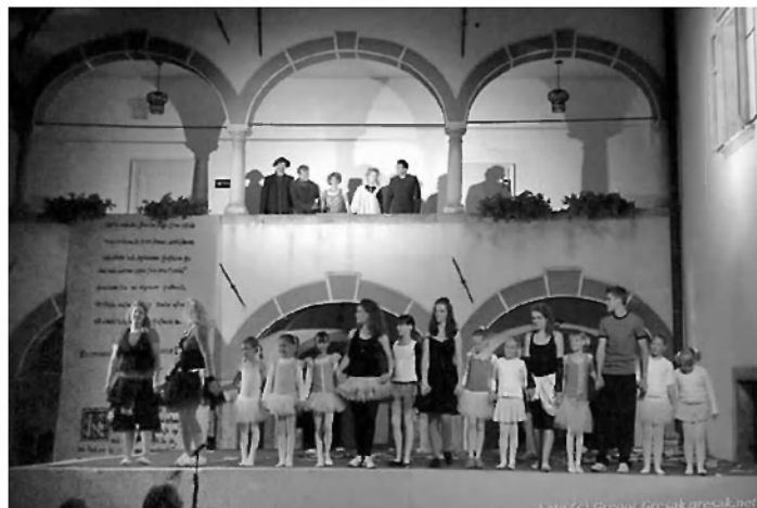
Igralska in baletna ekipa pri priklonu ob koncu prestave.