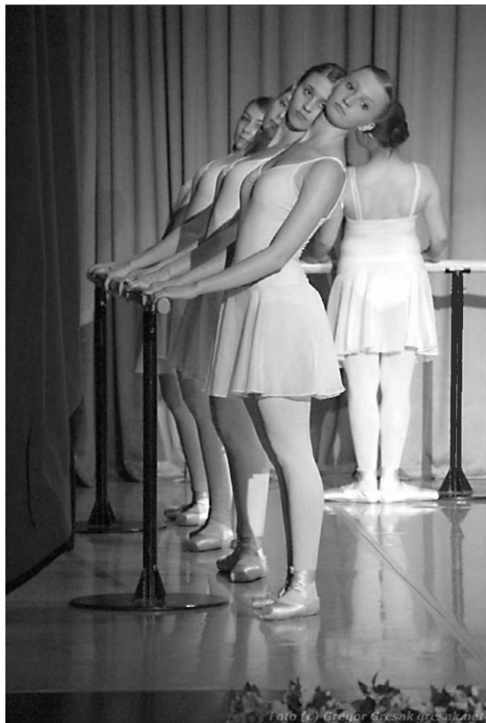
Najstarejša baletna skupina iz Ljubljane v zbrani drži.