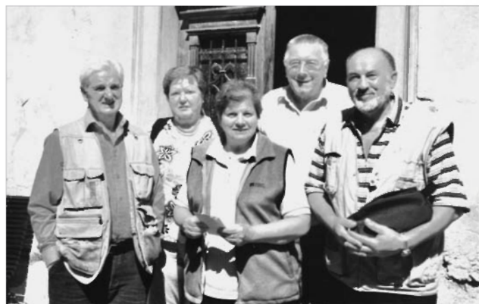
Predstavniki društva ob izročitvi denarnih prispevkov v Železnikih

Ustavili smo se v Ribčevem Lazu ob cerkvici sv. Janeza in na kamnitem mostu ogledovali neokrnjeno naravo, gore, jezero, ki ima krasno zatišno lego v gorskem kotliču ob-