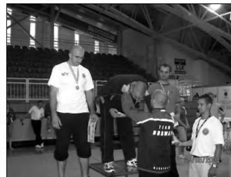
Edo – naslov svetovnega pokalnega zmagovalca