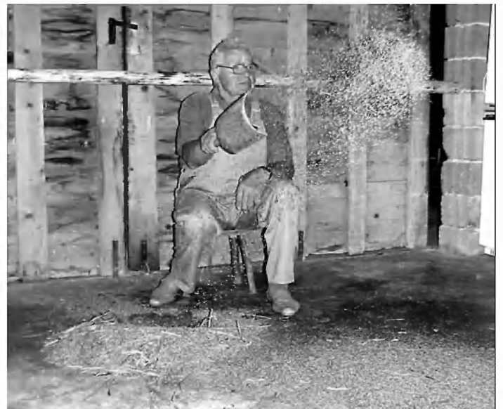
Vejanje prosa. Pri metanju z vevnico zrnje zleti na določeno mesto, pleve pa ostanejo ločeno pred zrnjem.

Nasmehne se : »Za začetek ni prav slab in tud ne prav dobr,« nato pa resno nadaljuje: »Prva letina oziroma pridelek ni