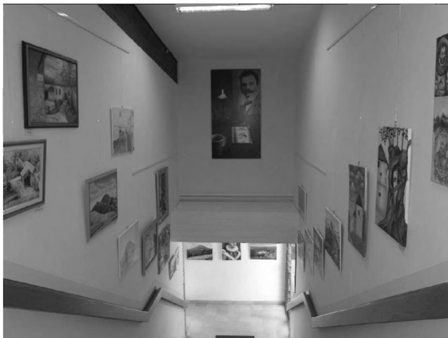
Razstava v hodniku knjižnice Škofljica