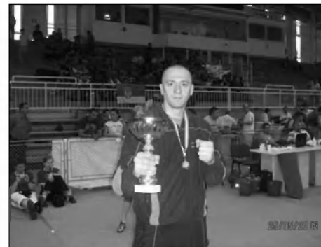
Edo&Pokal SP 2008