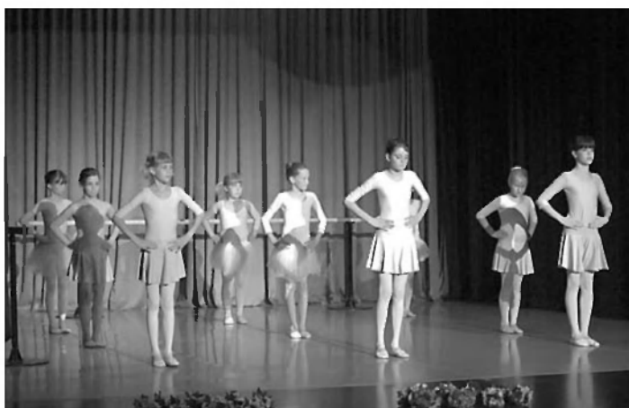
Nastop starejše skupine baletne sekcije KUD Primoža Trubarja.