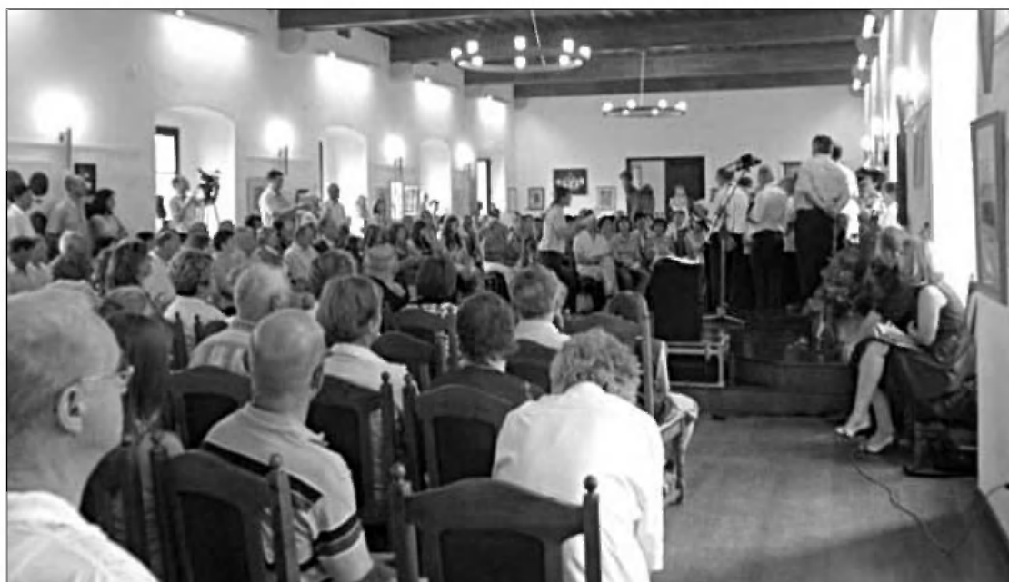
Popoldanski del tabora v viteški dvorani.