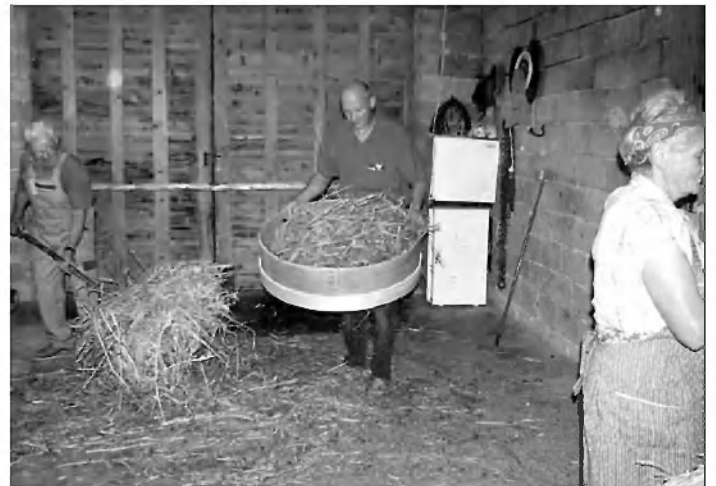
Retanje prosa. Slama ostane na reti, zrnje pa na podu.

bodo pripravljale in ponudile obiskovalcem Gradeža članice društva za ohranjanje dediščine.