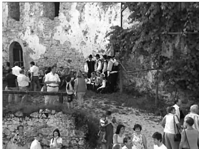
Nadaljevanje druženja na grajskem dvorišču.

Po organiziranem kosilu, ki so ga pripravile kuharice v osnovni šoli je sledil voden ogled Trubarjeve domačije. Popoldanski del tabora pa je potekal v viteški dvorani