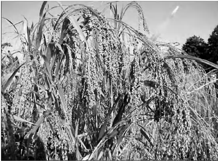
Proso je zrelo za žetev

V prejšnji izdaji Troble ste lahko prebrali članek Trubarjeva malica – prosena kaša. Za vse tiste, ki so le naši občasni bralci, naj ponovimo, da so letos na Gradežu posejali proso po starih običajih. Proso je v tem času že dozorelo, žanjice so ga požele, zvezale v snope, in proso danes že ometo, prečiščeno in osušeno čaka na mlinске stope, da ga oluščijo lupin in presejejo.