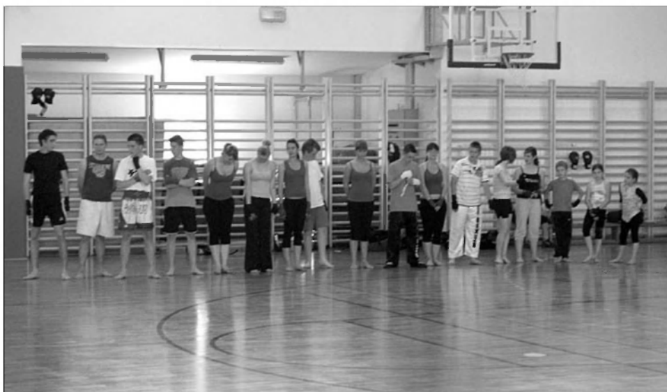
Pred nastop ob zaključku 1.sezone