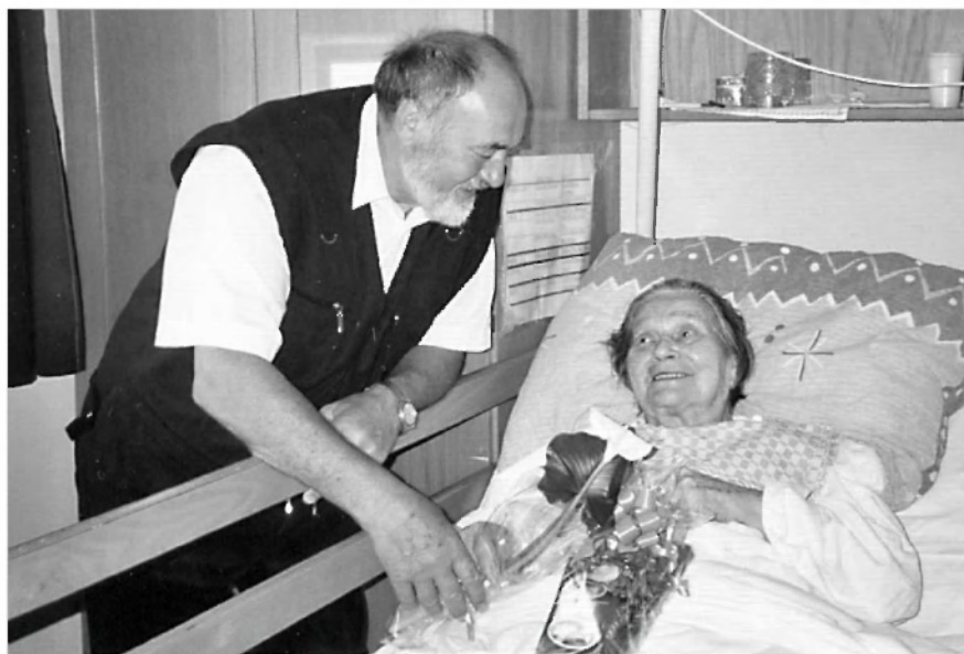
Obisk v Domu starejših občanov na Vrhniki.