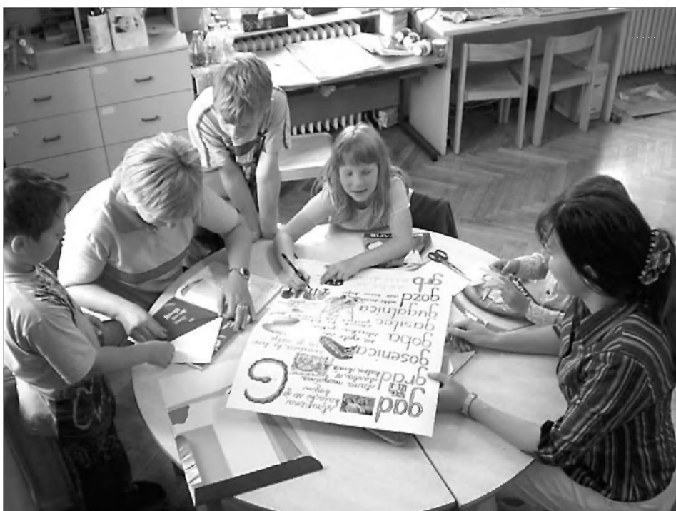
Ustvarjanje strani za knjigo velikanko na Podružnični šoli Sveti Gregor.