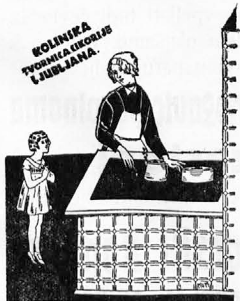
Prava KOLINSKA CIKORIJA!

Izlet v Celje. V nedeljo, dne 9. novembra t. l. priredijo člani »Svobode« in »Prijatelja Prirode« iz Trbovelj in Hrastnika skupni izlet v Celje, in sicer ena skupina pešizlet