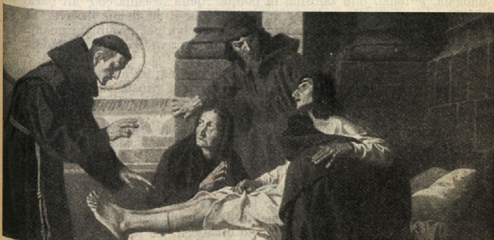
Cerkev v Mühlhausen — Sv. Anton ozdravi odsekano nogo

Nekatere sem slišal reči, da je prva potreba za opravičilo priznanje, da je človeška narava do temelja pokvarjena in da vse stremljenje po rešitvi iz te pokvarjenosti ni nič drugega nego začetek napuha, ki