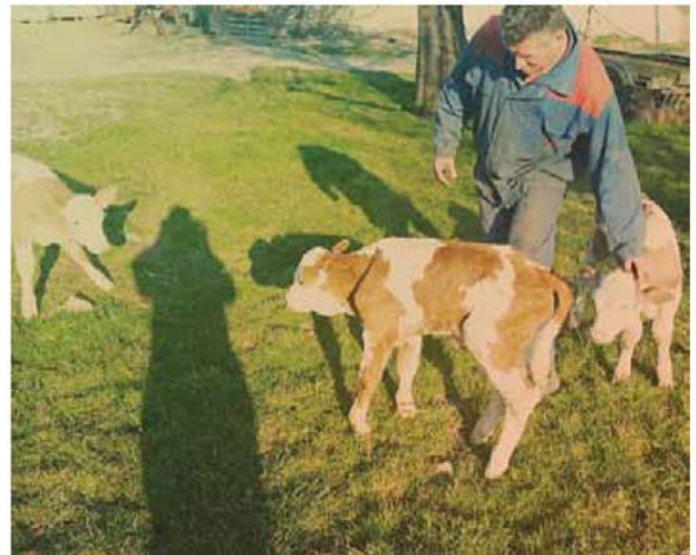
Pri Korentovih so se skotili telčki trojčki