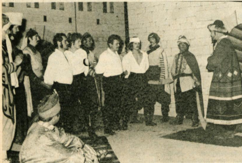
Dramska skupina KUD „Franc Kotar“ Trzin ob uprizoritvi Miklove Zale