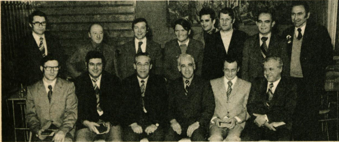
Na sliki vidimo odlikovance, ki jih je ob Dnevu JLA odlikoval vrhovni komandant maršal Tito z vojaškimi odlikovanji

Obenem se v imenu vseh udeleženk tečaja zahvaljujem tovarišici Nuši Pirjevci za njen trud in potrpljenje.