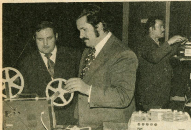
Člani Foto-kino kluba MAVRICA pri montiranju posnetih filmov

V zimskih in pomadanskih mesecih leta 1974 so priredili za člane kluba več predavanj o foto in kino tehniki, kompoziciji, filmski estetiki in vzgoji.