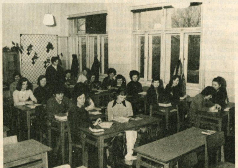
Na sliki vidimo del slušateljic 2. letnika dvoletne Administrativne šole v organizaciji Delavske univerze

Strokovni nivo kadrov in razpoložljiva finančna sredstva bodo predstavljala kakovost opravičila za javnost.