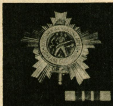
Medalja – Red ljudske armade s srebrno zvezdo

Priznanja pomenijo za veliko vaše delo pri prizadevanju na področju izgradnje sistema splošnega ljudskega odpora. Ta priznanja pa ne predstavljajo samo vrednotenje preteklega dela, ampak predstavljajo tudi vzpodbudo za še večje zalaganje na področju varnosti in vsesplošne obrambne