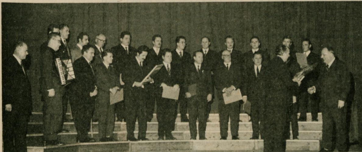
Moški pevski zbor Gasilskega društva Radomlje

2. Področje vzgoje in izobraževanja v občini Domžale je v primerjavi z nekaterimi drugimi občinami v Sloveniji že precej razvito, vendar so še določena vprašanja, ki terjajo nujne rešitve. Mnogo bo še treba storiti, da izravnamo pogoje za vzgojno in izobraževalno delo na celotnem območju naše občine. To pa bo uresničeno šele takrat, ko bodo dani vsi pogoji za prehod na celodnevno šolo.