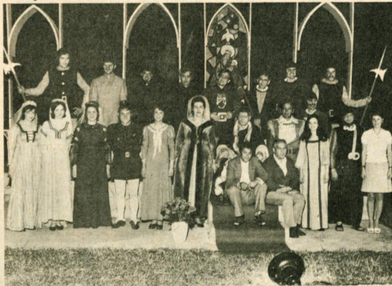
Dramska skupina DKPD Svoboda Mengeš ob uprizoritvi Veronike Deseniške

Največ dela pa so imeli z organizacijo in izvedbo XI. festivala