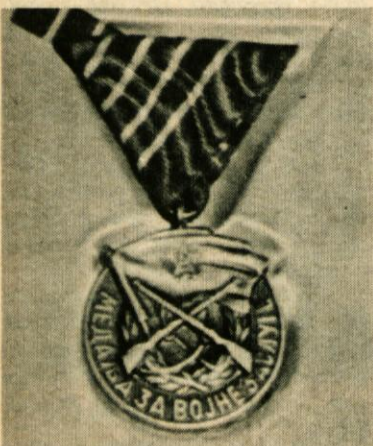
Medalja za vojaške zasluge

in da je to lepo priznanje za njihovo zalaganje med drugim je predsednik Lenič dejal: