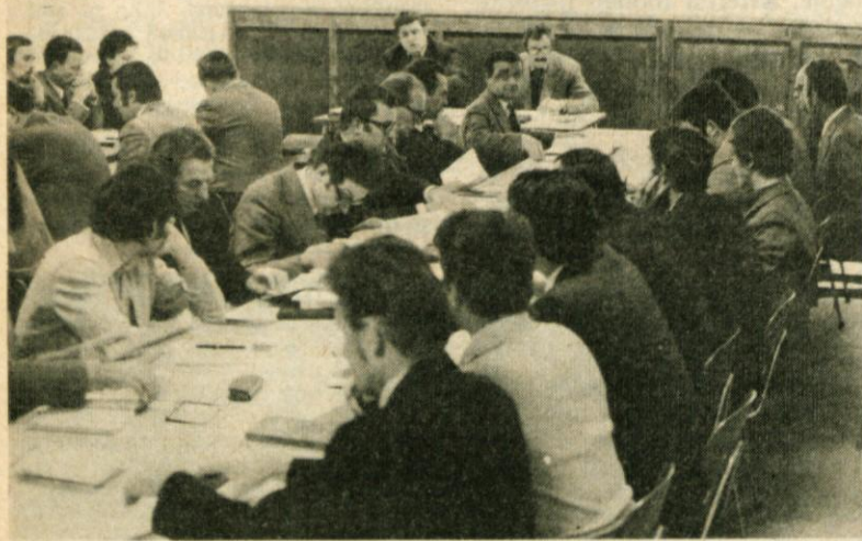
Posvetovanje sekretarjev osnovnih organizacij ZK v Jaršah

O poteku in zaključkih posvetovanja bomo obširneje poročali v prihodnji številki.