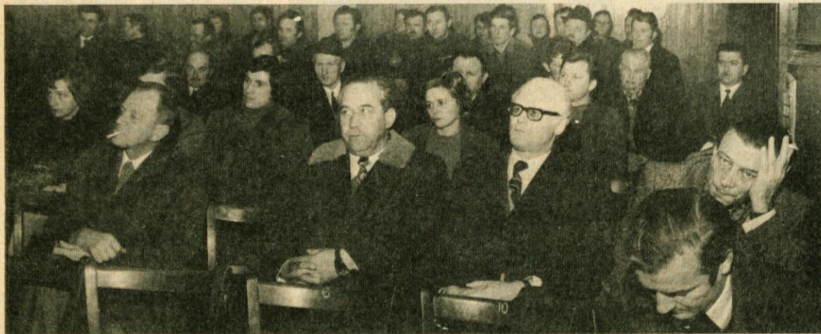
Na zboru delovnih ljudi in občanov v Lukovici so razpravljali o mnogih krajevnih problemih