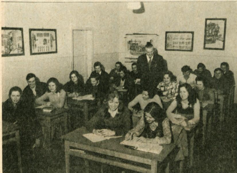
Skupina slušateljev štiriletne Tehniške tekstilne šole, ki jo organizira Delavska univerza Domžale

V I. letniku Administrativne šole je vpisanih 46 slušateljic, v II. letniku Administrativne šole je 37 slušateljic in v II. letniku Tehniške tekstilne srednje šole je 31 slušateljic. Zanimanje za Administrativno šolo se po vpisanih slušateljicah vidi, da je vsako leto večje. Matična šola daje možnost vpisa vsem slušateljicam, ki so dopolnile 16 let starosti, vendar pod pogojem, da so zaposlene. Slušateljice v II. letniku Administrativne šole čaka v letošnjem letu zrelostni izpit, to je matura. Maturo bodo opravljale iz petih predmetov.