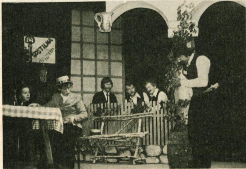
Igralci dramske skupine DPD Svoboda Ihan ob uprizoritvi Cankarjevih Hlapcev

V mesecu januarju 1975 so že nastopili na prireditvi v Rudniku pri Radomljah, pripravljajo pa se za celovečerni koncert. Sodelovali bodo tudi na reviji pevskih zborov, na krajevnih prireditvah in večjih občinskih proslavah.