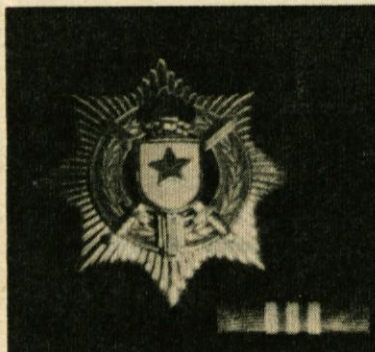
Medalja – Red za vojaške zasluge s srebrnimi meči