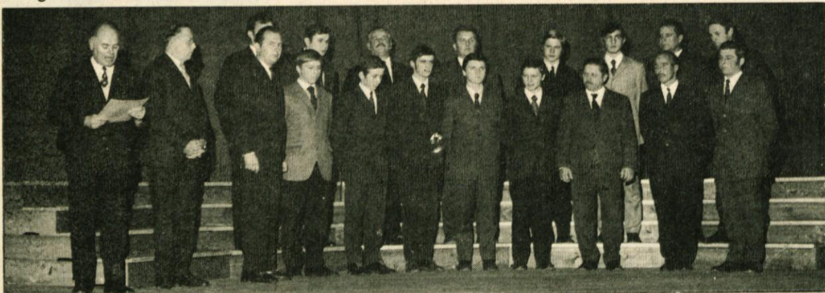
Moški pevski zbor KUD „Janko Kersnik“ Lukovica

V letu 1974 je imel oktet preko 50 vaj in skoraj 20 nastopov v raznih krajih Slovenije. 27. januarja je nastopil v Radomljah na javni radijski oddaji „Koncert iz naših krajev“, isti dan popoldne pa v Cerkljah na javni oddaji RTV Ljubljana „Koncert iz naših krajev“. 8. februarja so nastopili na