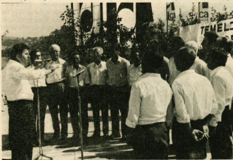
Moški pevski zbor Prosvetnega društva „Tine Kos“ Moravče

Moški pevski zbor Radomlje deluje v okviru Gasilskega društva Radomlje. Tedensko ima eno vajo in nastopa predvsem v krajevnem obsegu. Zbor je večkrat nastopil skupaj s Pevskim zborom Društva upokojencev Domžale na raznih večjih proslavah in zborovanjih. V zboru sodeluje 18 pevcev. V Radomljah so sodelovali na vseh proslavah in prireditvah, na deključini in komemoraciji za 1. november. Skupaj z Mešanim pevskim zborom DKPD Svo-