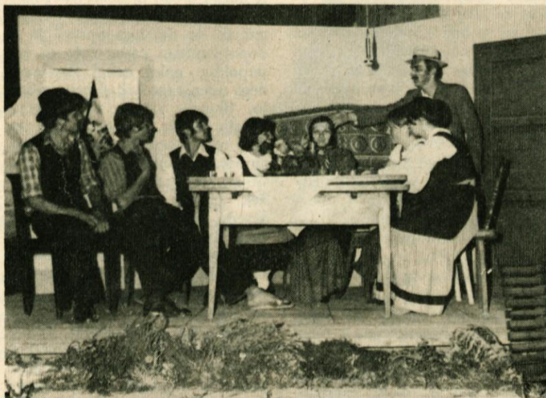
Člani dramske skupine Prosvetnega društva „Jožef Virk“ iz Doba pri Domžalah ob uprizoritvi Dekle Ančke