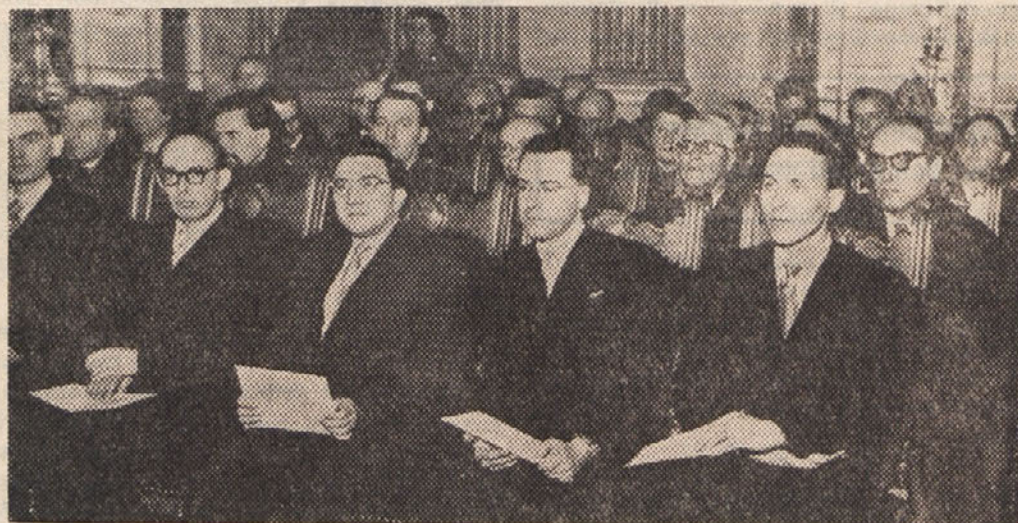
Na sliki vidimo del letošnjih nagrajencev Körnerjeve ustanove, med katerimi je — kakor smo poročali že v predzadnji številki — tudi pet Korošcev. Doslej je bilo v okviru Körnerjeve ustanove razdeljenih nad milijon šilingov med umetnike in znanstvenike.

Njegovi nauki niso padli na neplodna tla. Že pred letom 1848, posebno pa v 50. in 60. letih sta to pokazala Slomškova učenca Matija Majar in Andrej Einspieler, katerima se je pridružil po letu 1848 še delavni in požrtvovalni Anton Janežič, ki je s svojim literarno-organizatorskim delom pritegnil vse tedanje napredne pisateljske moči v Celovec, kjer se je takrat razvilo tudi napredno politično življenje in je Celovec postal vodilno mesto v slovenskem kulturnem življenju.