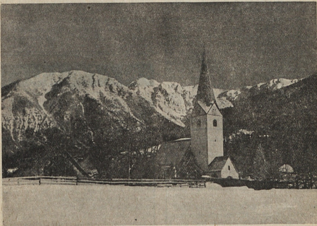
Šmarjeta v Rožu na Koroškem