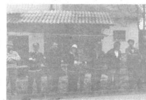
Navijač. z zanimanjem spremljajo prvo ligaško srečanje prve ekipe Horjula.

V prvi polovici maja so se začela tekmovalja v SBL – zahod in sever. Horjul v prvih dveh krogih ni imel uspeha, saj je izgubil proti 8. septembru iz Štanjela in Erasmu iz Postojne, nadaljevanje pa je prineslo veliko več, kot bi lahko pričakovali – gladki zmagi nad Anteno iz Portoroža in Plamo iz Podgrada ter v zadnjem kolu spomladanskega dela tesno zmago nad Hermesom iz Ljubljane. Tako je zdaj Horjul uvrščen na 5. mesto lestvice SBL – zahod, pri čemer zaostaja 2 točki za vodčim Jadranom in točko za 8. septembrom, medtem ko imata 3. Hrast in 4. Erazem enako število točk. Vsekakor lep uspeh za tekmovalce brez izkušenj s podobnih tekmovalj.