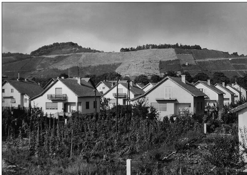
Vir PAMB, fond Zavod za urbanizem Maribor 17. stoletje-1989, t. e. 6/32.