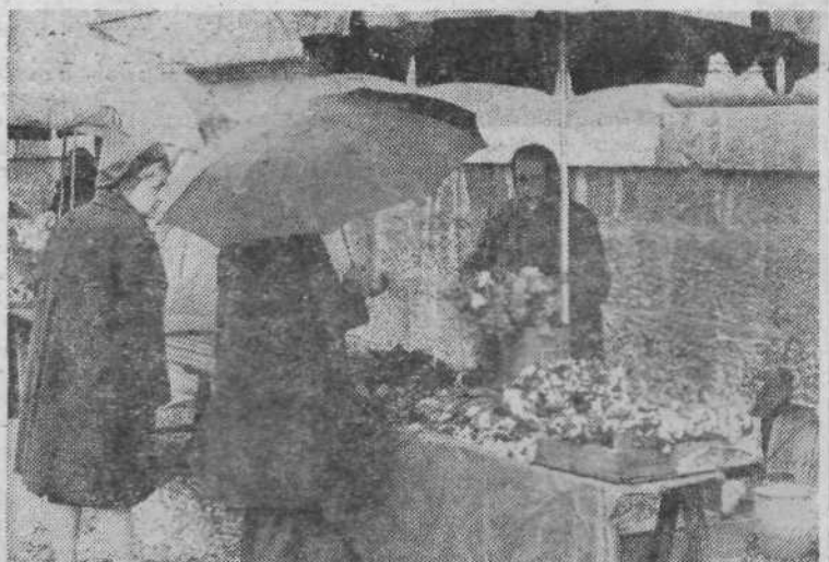
4. POMLADANSKO CVETJE — Ljubitelji cvetja lahko na ljubljanskem trgu že za nekaj dinarjev kupijo pomladansko cvetje. Toplo sonce, ki je v nižjih legah stopilo sneg, je že prebudilo prve znanilce pomladi.