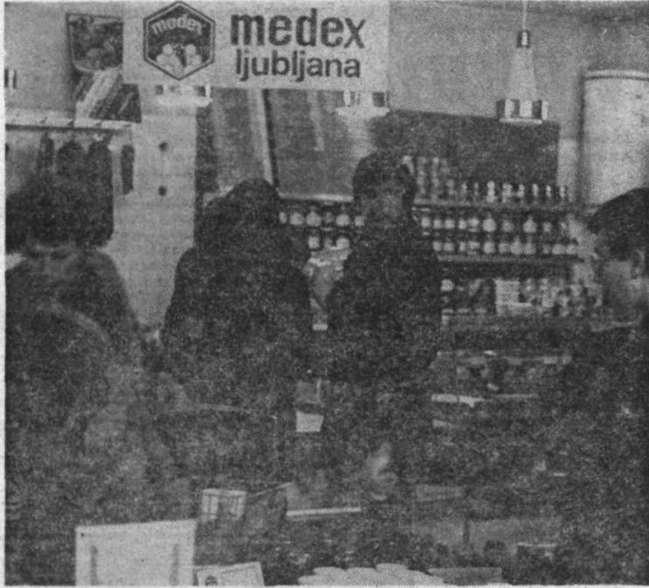
Svet potrošnikov krajevne skupnosti Savsko naselje je sredi decembra — v sodelovanju z Medexom in Mercatorjem (Emona žal ni pokazala razumevanja) — priredil pokušno več kot 10 vrst medu in medenih napitkov. Zanimanje je bilo zelo veliko. Posebno degustacijo so priredili tudi na osnovni šoli Borisa Kidriča.