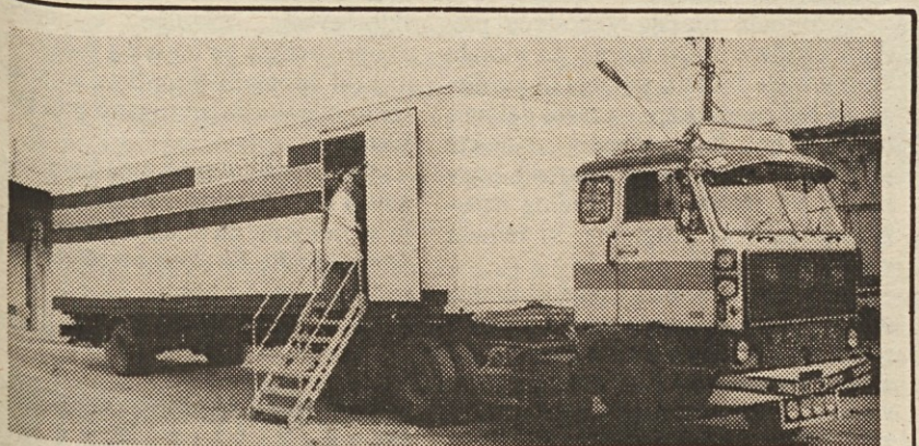
Pred kratkim je Iskra Elektromehaniko obiskala potujoča razstava firme Amphenol. Ta velika ameriška firma, ki ima svoje tovarne v Evropi, Indiji in na Japonskem, je znan proizvajalec konektorjev. V svojem proizvodnem programu ima tudi razne kableske zveze, koaksialne VF zveze, konektorje za tiskana vezja, koaksialne kable in potenciometre. Sodeluje tudi z nekaterimi našimi temeljnimi organizacijami, s Tovarno računalnikov, Elektroniko Horjul, TEN, itd.