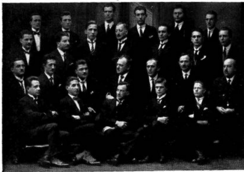
Pevski zbor Grafike ki bo nastopil v našem studiu v sredo zvečer

Dovolj je molčanja in krotkega prenašanja. Slovenski poslušavec se drami in nihče ga ne bo več ustavljal!