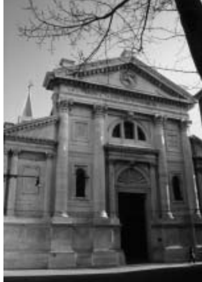
13. Andrea Palladio: San Francesco della Vigna, pročelje, ok. 1565, Benetke.

hajajo tudi s pročelja cerkve Santa Maria del Giglio: volute, figure viktorij in puta na agrafi nad portalom. 47