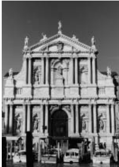
9. Giuseppe Sardi: Santa Maria di Nazareth degli Scalzi , pročelje, 1672–1680, Benetke.