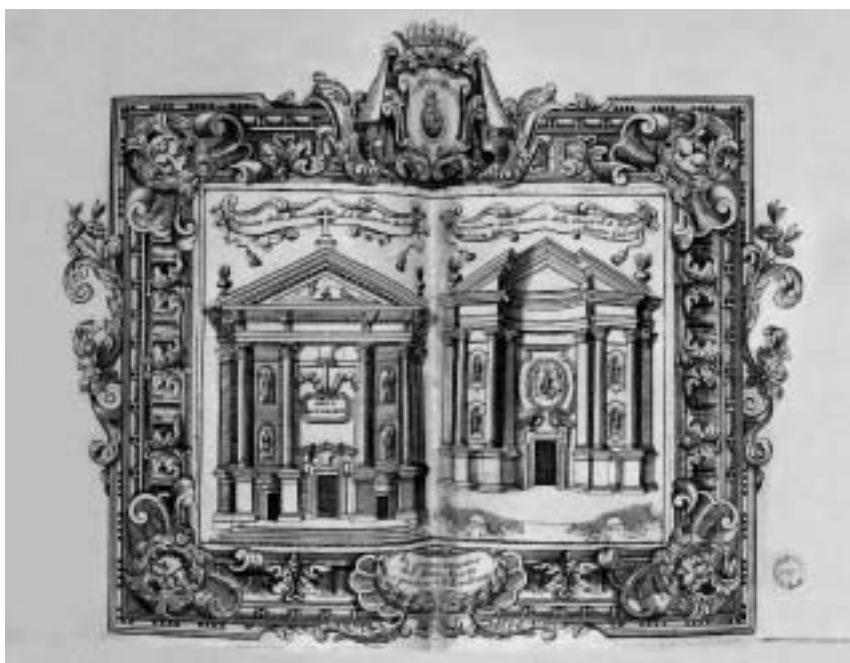
2. Gian Giacomo Gaspari: prvi in drugi predlog pročelja za cerkev San Stae v Benetkah (bakrorez Vincenza Coronellija), 1709.