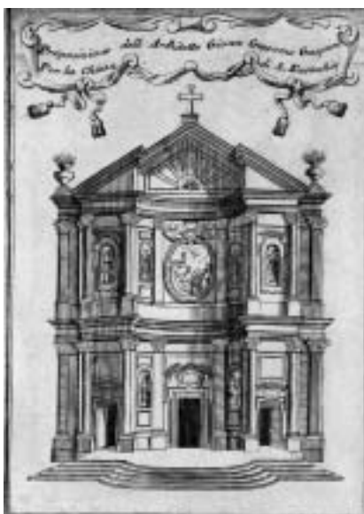
6. Gian Giacomo Gaspari: četrti predlog pročelja za cerkev San Stae v Benetkah (bakrorez Vincenza Coronellija), 1709.