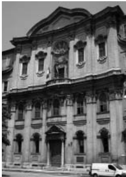
5. Francesco Borromini: Oratorij sv. Filipa Nerija , pročelje, 1637–1644, Rim.

Fontane iz let 1665–1667 (sl. 7) in pročelje San Marcella al Corso, ki ga je v letih 1682–1683 zgradil Carlo Fontana. 17 Gaspari je v tem primeru kakor Borromini zasnoval triosno konkavno pročelje in kakor Fontana načrtoval aplikacijo od starejše cerkvene notranjščine neodvisne, manifestativno sodobno oblikovane fasade. 18 Rimski fasadi sta mu posredovali tudi motiv okvirja za svetniško podobo, ki je pri Fontani postavljen v čelo pritlične, pri Borrominiju pa v čelo nadstropne edikule. Motiv prevojnega čela, ki ga je uporabil tudi v naslednjih dveh predlogih za San Stae (kot timpanon edikule oziroma nadstropja), je verjetno izpeljan iz zaključka Berninijeve oltarne edikule v kapeli Cornaro (1647–1652) v cerkvi Santa Maria della Vittoria v Rimu. 19