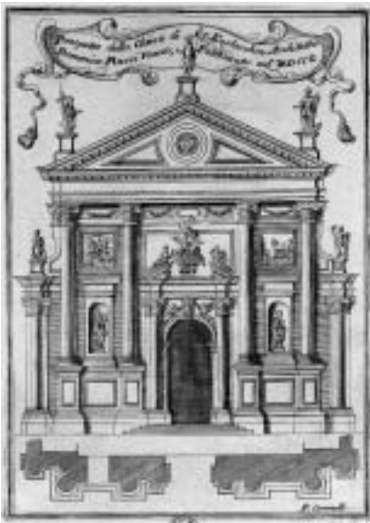
14. Domenico Rossi: zmagovalni predlog pročelja za cerkev San Stae v Benetkah (bakrorez Vincenza Coronellija), 1709.