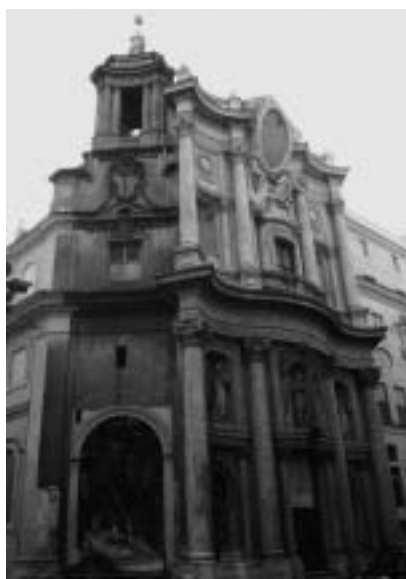
7. Francesco Borromini: San Carlo alle Quattro Fontane , pročelje, 1665–1667, Rim.

Gasparijev tretji načrt (sl. 4) 20 posnema pročelje beneške cerkve degli Scalzi (sl. 9), 21 ki ga je v letih 1672–1680 v Benetkah postavil Giuseppe Sardi. 22 Gian Giacomo je v tem primeru predlagal kompromisno Sardijevo fasadno shemo, ki je bila kombinirala beneško sansovinovsko cerkveno fasado z enakomerno razpostavljenimi nosilnimi elementi in rimsko visokobaročno cerkveno fasado z značilnima motivoma edikule in trikotnega čela. 23 Načrt iz leta 1709 je bil premišljen z več vidikov. Na eni strani je z ozirom na konzervativno umetnostno ozračje