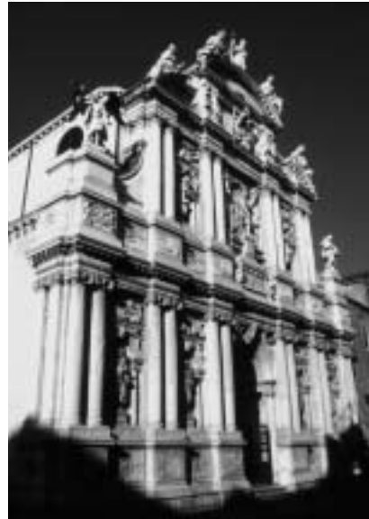
11. Giuseppe Sardi: Santa Maria del Giglio , pročelje, 1678–1681, Benetke.