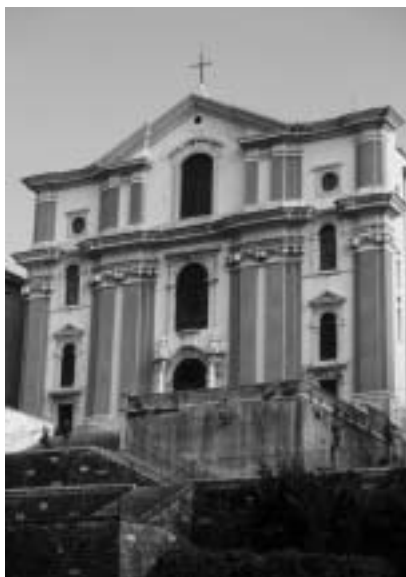
22. Giuseppe Pozzo: Santa Maria Maggiore, pročelje, 1707–1722, Trst.