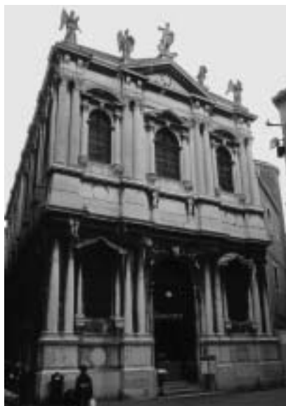
17. Antonio Sardi: Scuola Grande di San Teodoro, pročelje, 1654–1657, Benetke.