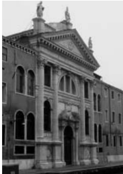
15. Antonio in Giuseppe Sardi: San Lazzaro dei Mendicanti , pročelje, 1665–1673, Benetke.

Ob vplivu Palladia in obeh Sardijev, ki sta posredovala paladijevske, pa tudi sansovinovske motive, je treba omeniti še tretji vir Rossijeve fasade – arhitekturo Palladijevih posnemovalcev. Rossi je namreč na pročelju cerkve San Stae kombiniral veliki in mali steborni red na različno visokih nosilcih, čemur se je Palladio v nasprotju s svojimi nasledniki in epigoni iz estetskih razlogov izogibal. Tako je Rossijeva fasada z zasnovo in s proporci zelo blizu Scamozzijevi predlagani fasadi za cerkev San Nicolò da Tolentino iz leta 1590 (sl. 20). 49 Z njo jo povezuje tudi veliki panel nad portalom, ki ga je Rossi uporabil za okvir kiparske skupine.