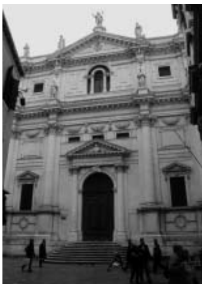
18. Antonio Sardi: San Salvatore, pročelje, 1660–1666, Benetke.