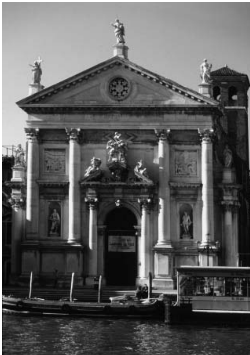
1. Domenico Rossi: San Stae , pročelje, 1709–1712, Benetke.