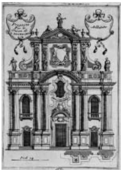
21. Giuseppe Pozzo: prvi predlog pročelja za cerkev San Stae v Benetkah (bakrorez Vincenza Coronellija), 1709.