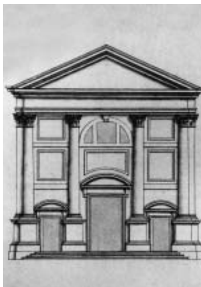
3. Baldassare Longhena: načrt pročelja za cerkev San Pantaleone v Benetkah (risba Antonia Visentinija), ok. 1682.