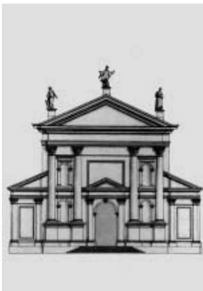
20. Vincenzo Scamozzi: načrt pročelja za cerkev San Nicolò da Tolentino v Benetkah (risba Antonia Visentinija), ok. 1590.

načrta (sl. 21) se zgleduje po pročelju jezuitske cerkve Santa Maria Maggiore v Trstu (sl. 22), 61 ki je približno sočasno delo samega Giuseppeja ali pa njegovega slavnjšega brata Andree Pozza. 62 Tržaški fasadi in beneškemu predlogu so skupni triosnost, atiško nadstropje z malim trikotnim timpanonom, povezava glavnega portala in velikega okna vzdolž osrednje osi ter različni nivoji oken. Če tem elementom ni mogoče pripisati nedvoumno rimske provenience, pa je to mogoče storiti pri tlorisu, ki predvideva stopnjevanje plastičnosti ostenja proti centru pročelja. Prispevek Pozzovega osebnega sloga je razkošna oblika osrednjega okna, ki jo je arhitekt pred letom 1700 uporabil že na velikem Marijinem oltarju cerkve svojega matičnega samostana Santa Maria della Laste pri Trentu. 63