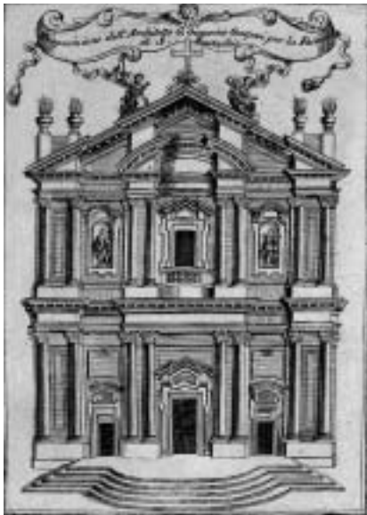
4. Gian Giacomo Gaspari: tretji predlog pročelja za cerkev San Stae v Benetkah (bakrorez Vincenza Coronellija), 1709.