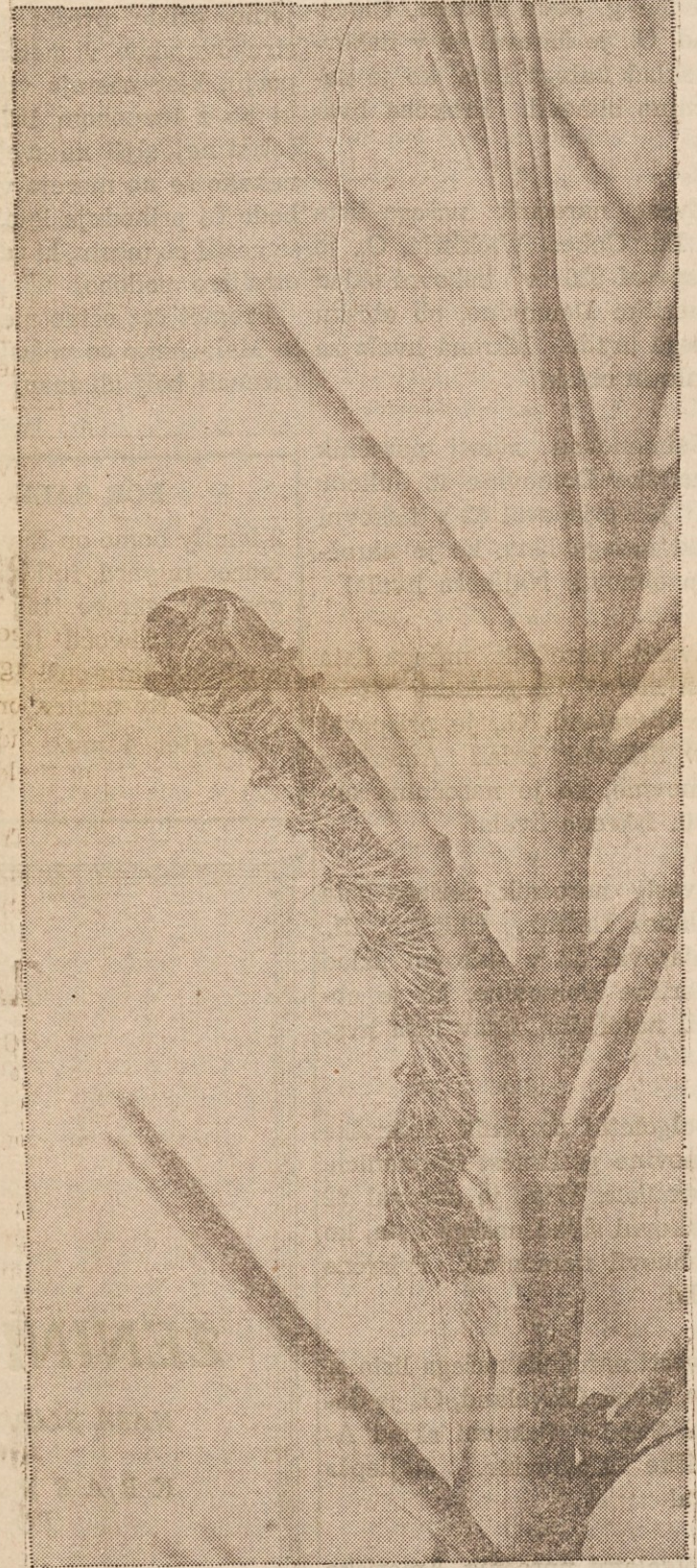
The tree-defoliating gypsy moth caterpillar munches its way through thousands of acres of trees during its annual surge. The pest is moving farther and faster with the help of the vast camping public. Gypsy moth caterpillars, pupae, and egg masses can be attached to anything stationary in the woods, so a simple tent, camp stove, lawn chair, or truck-mounted camper can be the carrier of a new infestation when the unknowing camper starts traveling.

POKONČNA POSTELJA — Astronavt Charles Conrad Jr., 42 let, ki je določen za poveljnika odprave SKYLAB prihodnje leto, ki bo na poti okoli Zemlje 28 dni, preskuša “vesoljsko posteljo” v središču NASA v Houstonu, Tex.