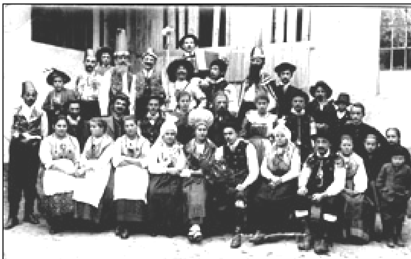
Igralska zasedba Miklove Zale okoli leta 1925. V igri so nastopali tudi člani družine Okorn (original hrani družina Okorn).