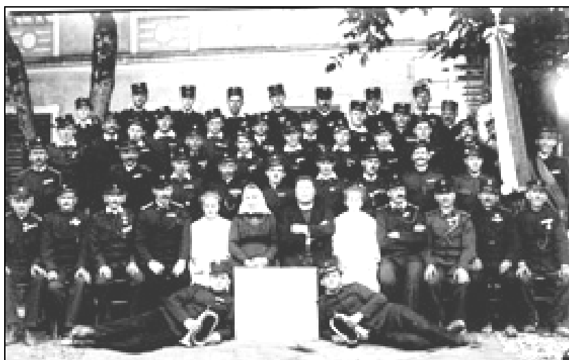
Fotografija je bila posneta ob praznovanju 25-letnice društva. Na gasilskem praporju je še komaj viden napis "Ob priliki 25 letnice (1989–1923)".