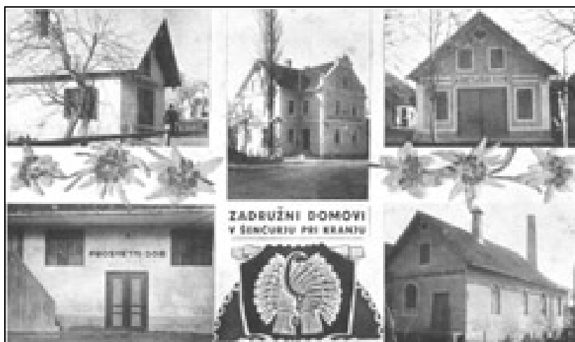
Na razglednici, odposlani leta 1937, vidimo zadružne domove v Šenčurju: Sadjarski dom, Hranilnico, Kmetijski dom, Prosvetni dom in Mlekarno (objavljena v stenskem koledarju Turističnega društva Šenčur za leto 1997)

bodo ob priliki natančno prikazali razvoj in delovanje zadružništva v Šenčurju, pa žal do tega ni prišlo. Poročajo pa o delu Sadjarske zadrage. Ustanovljena je bila namreč moderna sušilnica sadja v Sadjarskem domu, ki je leta 1937 osušila 3000 posod sadja. 10 Kmetijsko gospodarsko društvo je bilo tudi lastnik kotla za žganjekuho, 11 ki so ga Šenčurjani s pridom uporabljali. V privatni lasti so bili tedaj še trije kotli.