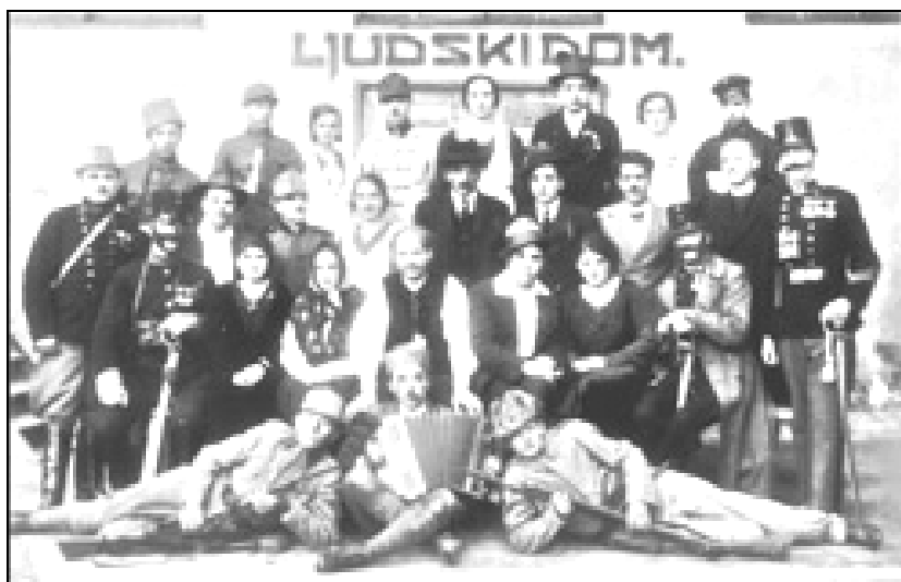
Igralska zasedba igre A njega ni... iz leta 1935

senečenega prijatelja. Vse sili vanj: Imaš pipo? Nimaš! Dinar, dinar!! In dinarčki se zbirajo v blagajno iz rok strmečega prijatelja, ki se je pustil tako gladko speljati. 44 Organizatorji so takoj dobili 30 članov, navdušenih in pripravljenih žrtvovati se za razcvet tega društva.